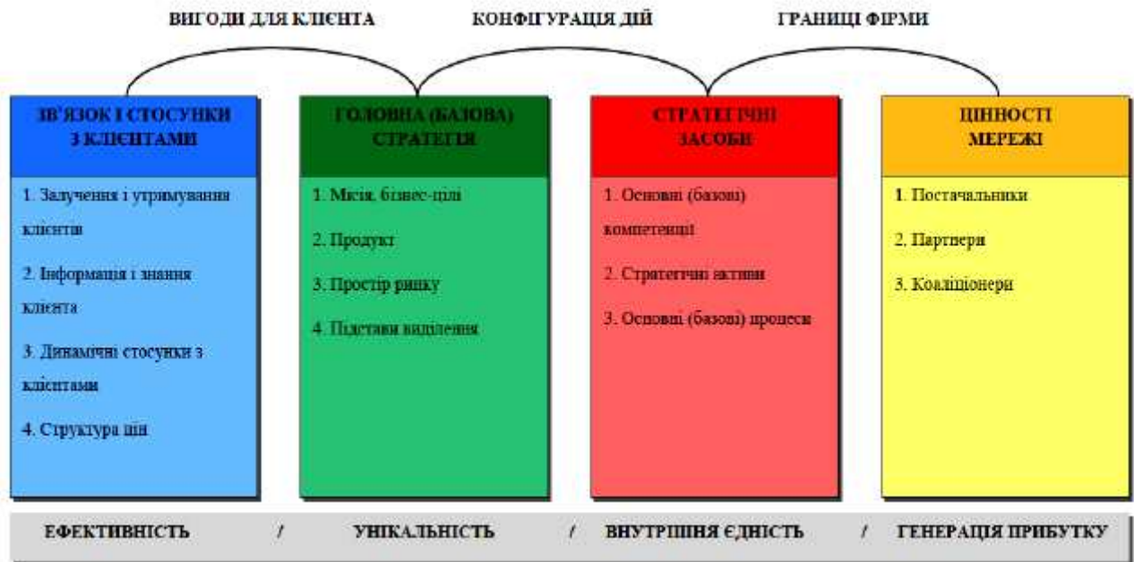
Рис. 2. Елементи інноваційної бізнес моделі [1]

Чотири найважливіші його елементи, тобто базова стратегія, стратегічні запаси, зв'язок і стосунки з клієнтами, цінності мережі взаємопов'язані, створюючи характерні три “мости”, що наведені нижче: