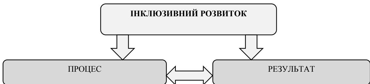
Рисунок 1. Діалектичність підходів до розгляду інклюзивного розвитку

На основі цього можна виділити два підходи до розгляду інклюзивного розвитку економіки, як результату та як процесу, які, певною мірою, можна розглядати як суперечливі (рис. 1). Процес «участі в» може, якщо довести його до крайності, поставити під загрозу результат «вигоди від» поліпшення якості життя, що впливає із зосередження уваги на інклюзивності в процесі розвитку.