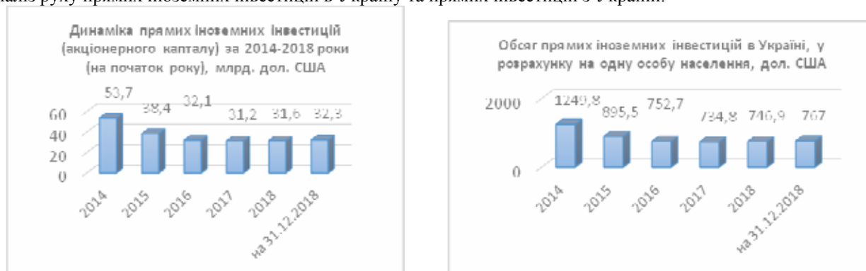
Рис. 1. Динаміка прямих іноземних інвестицій (акціонерного капіталу) за 2014-2018 роки (на початок року), млрд. дол. США та обсяг прямих іноземних інвестицій в Україні, у розрахунку на одну особу населення, дол. США (дані наведено без урахування тимчасово окупованої території Автономної Республіки Крим, м.Севастополя, за 2014–2018рр.–також без частини тимчасово окупованих територій у Донецькій та Луганській областях)

Для оцінки сучасного стану іноземного інвестування України проведемо комплексний порівняльний аналіз руху прямих іноземних інвестицій в Україну та прямих інвестицій з України.