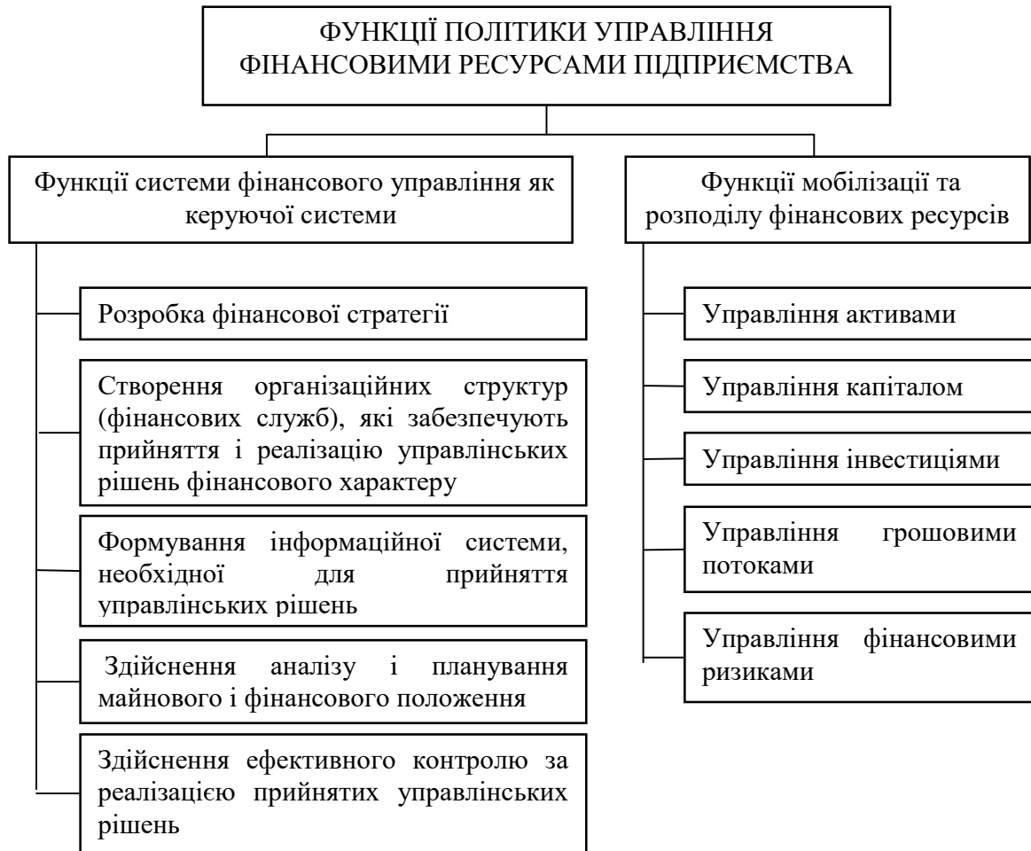
Рис. 3. Основні функції політики управління фінансовими ресурсами підприємства

Агресивний тип фінансової політики орієнтований на досягнення найбільш високих результатів при великому рівні ризику. Підприємство при даному типі політики інвестує кошти в проекти з високою прибутковістю і великими ризиками, встановлює низькі ціни на продукцію, а саме нижче ринкових, для збільшення попиту на товар, поточні активи фінансуються за рахунок поточних зобов'язань, містить великий обсяг запасів і активно надає відстрочки платежів [9, с. 26].