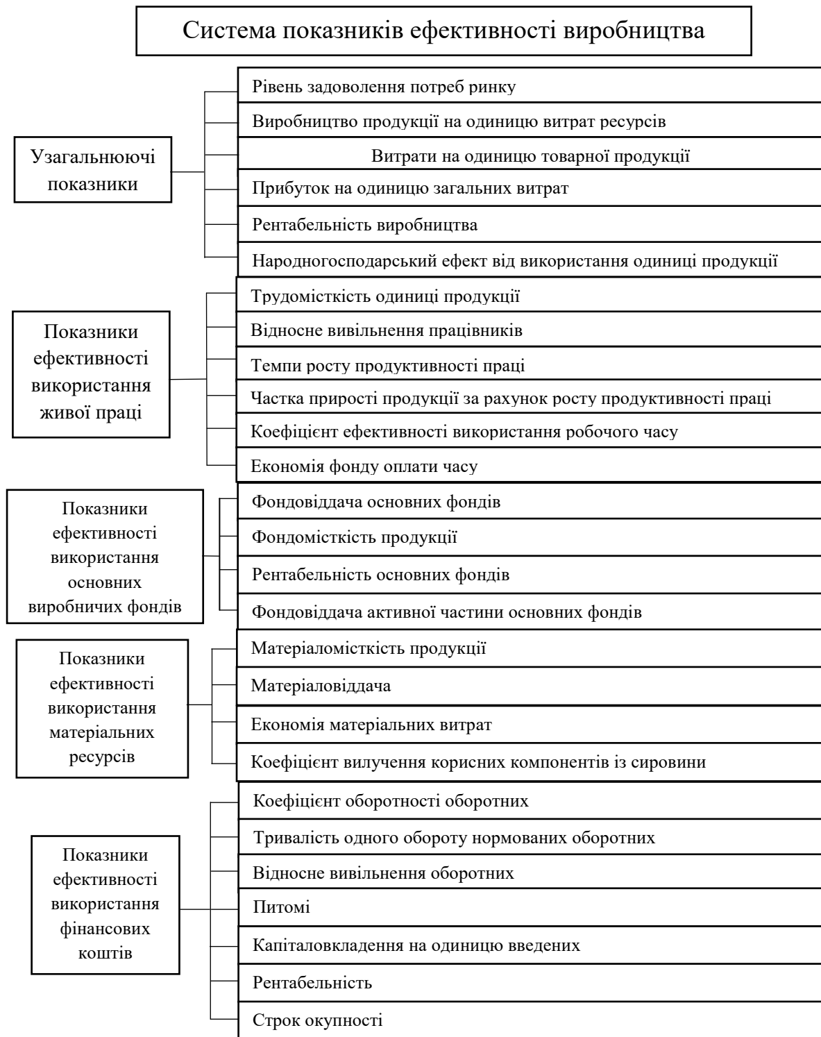
Рис. 1. Система показників ефективності виробництва

Слід зазначити, що показники економічної ефективності поділяються на часткові та загальні. До часткових належать: обсяг виробленої продукції, продуктивність праці, фондовіддача, матеріаловіддача, собівартість продукції [7].