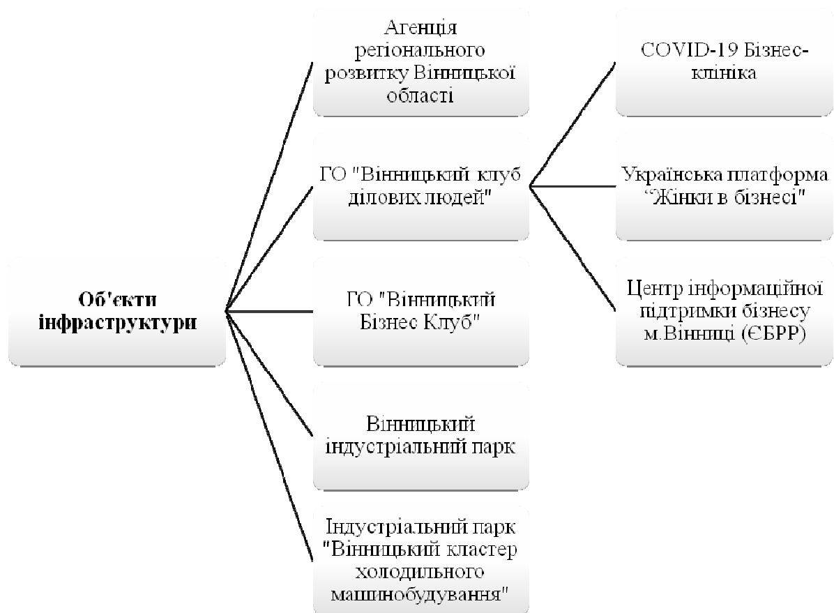
Рис. 3. Інфраструктура підтримки розвитку МСП Вінницького регіону

Разом з тим, в процесі впровадження політики розвитку МСП Вінницького регіону залишається ще досить багато проблемних питань, вирішення яких є критично важливим для збільшення кількості експортоорієнтованих МСП (табл. 1).