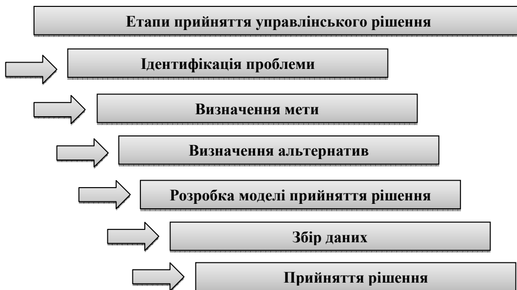
Рис. 1. Етапи прийняття управлінських рішень

Оскільки прийняття рішення є завершальним етапом управління, важливо розглянути послідовність прийняття управлінського рішення. В економічній літературі виділяють такі основні етапи у прийнятті управлінського рішення (рис.1):