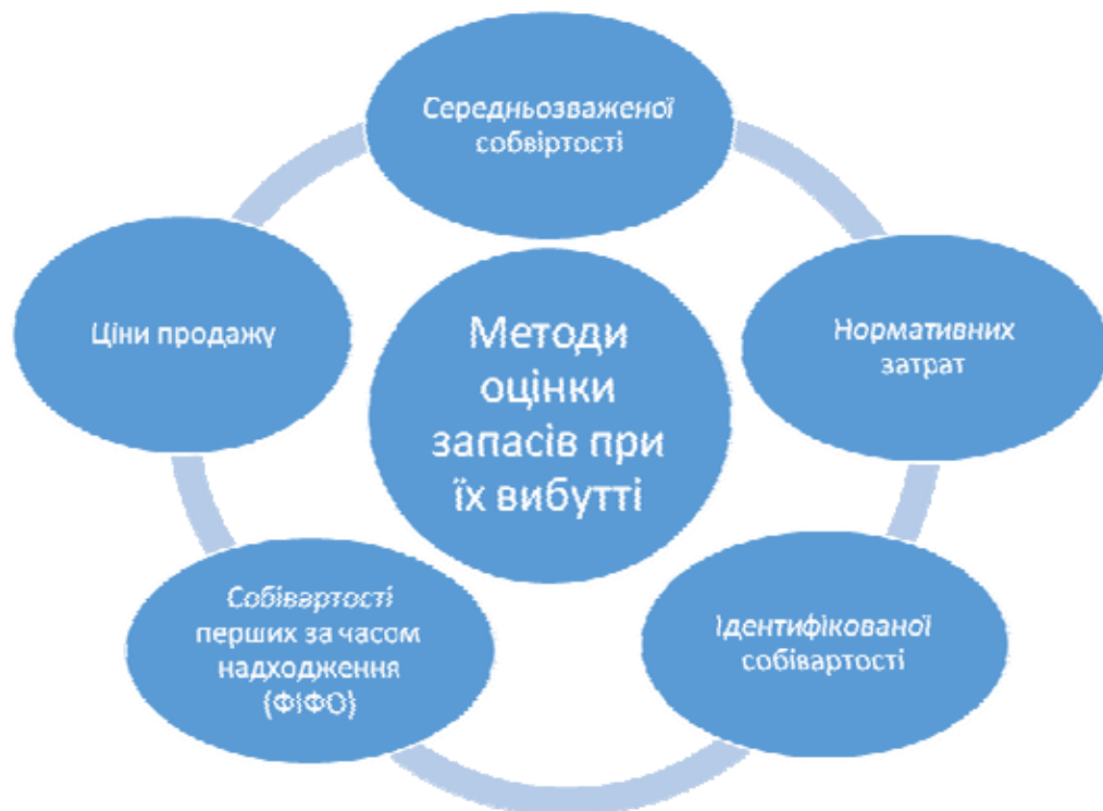
Рис. 2. Методи оцінки запасів при їх вибутті прийняті в Україні

Не менш важливого значення набуває й оцінка запасів при їх вибутті, адже це має прямий вплив на фінансовий результат діяльності суб'єкта господарювання. Навколо питання оцінки вибуття виробничих запасів постійно відбувається дискусія, який із методів краще застосовувати в практиці того чи іншого підприємства, залежно від того, який видом діяльності займається суб'єкт господарювання, який ефект намагається одержати в результаті провадження основної діяльності.