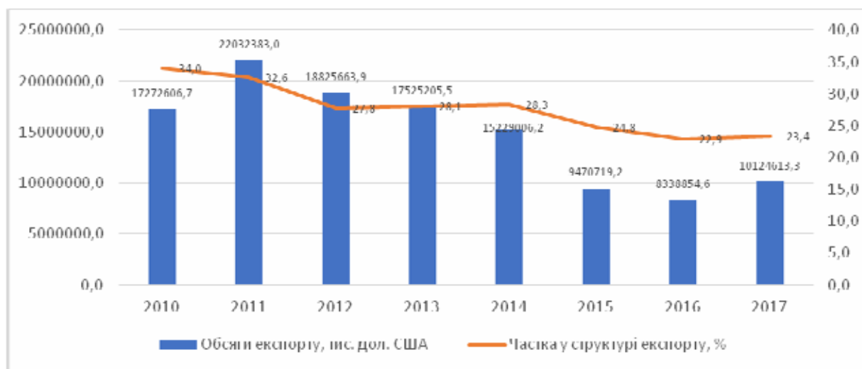
Рис. 1. Обсяги та питома вага експорту продукції металургійної галузі України у 2010 – 2017 рр.