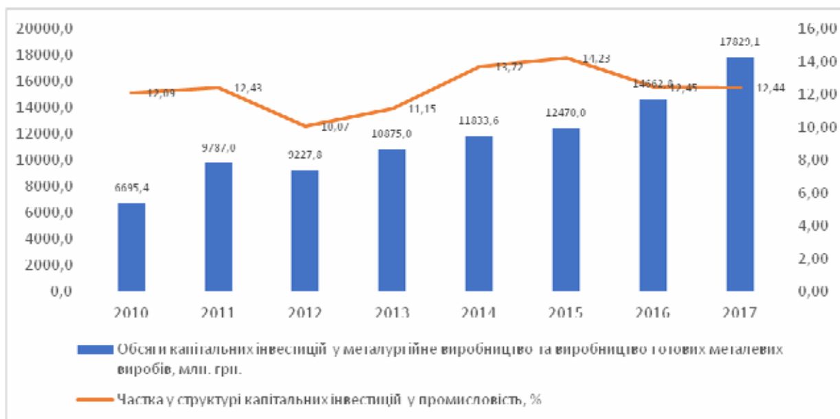
Рис. 2. Обсяги та питома вага обсягу капітальних інвестицій у металургійне виробництво та виробництво готових металевих виробів в Україні у 2010 – 2017 рр.