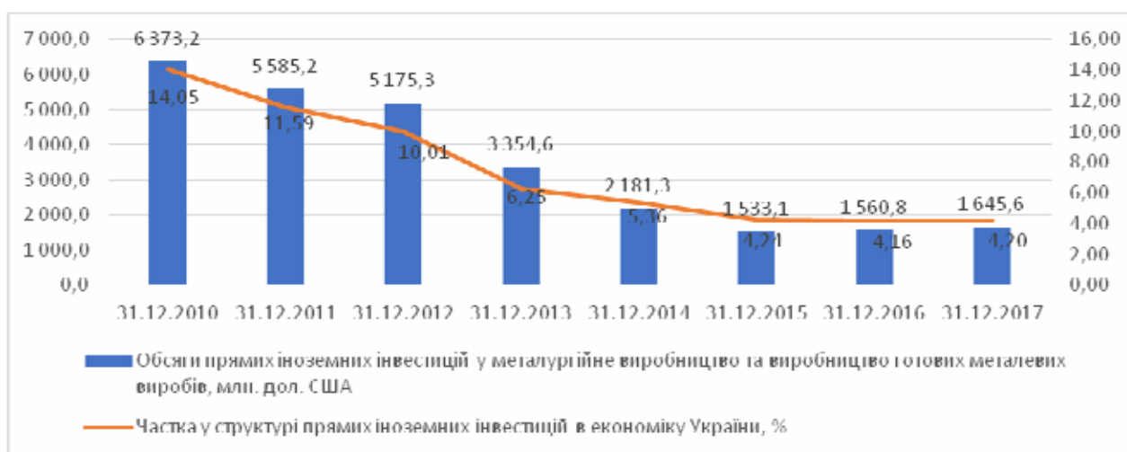
Рис. 3. Обсяги та питома вага обсягу прямих іноземних інвестицій у металургійне виробництво та виробництво готових металевих виробів в Україні у 2010 – 2017 рр.

Наразі ситуація із залученням прямих іноземних інвестицій у металургійну галузь України є досить складною: з огляду на військові дії на Сході країни, можливості інвестування у галузь значно знижуються. Окрім цього, ризики вкладення коштів у компанії, розміщені у безпосередній близькості до території проведення військових дій, так само як макроекономічні та політичні ризики, нині є надзвичайно високими – усе це обумовило зниження обсягів інвестицій у металургійну галузь за останні 7 років з 6373,2 млн. дол. США до 1645,6 млн. дол. США. Таким чином частка металургії у структурі прямих іноземних інвестицій зменшилася з 14,05% до 4,2%, при чому незначне зростання спостерігалось лише у 2017 р. (рис. 3).