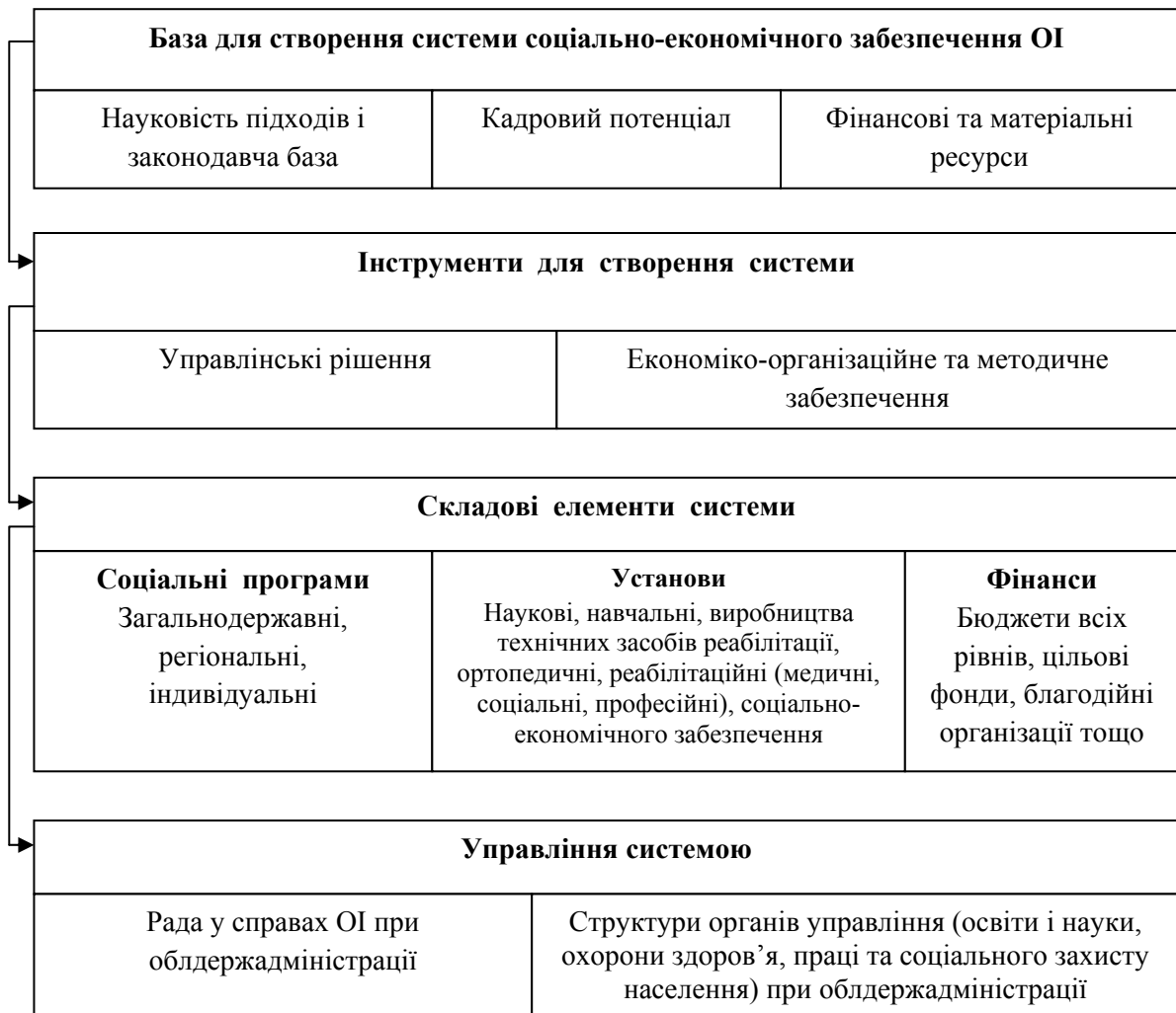
Рис. 3. Передумови формування системи соціально-економічного забезпечення осіб з інвалідністю*

Для досягнення такої складної мети необхідне створення повноцінного інституційного регулювання процесу інтеграції осіб з інвалідністю до соціально-економічної системи як сукупності ланок нерозривного ланцюга: наукових, законодавчих, управлінських, організаційних, виконавчих, економічних. Передумови формування системи соціально-економічного забезпечення осіб з інвалідністю наведені на рис. 3.