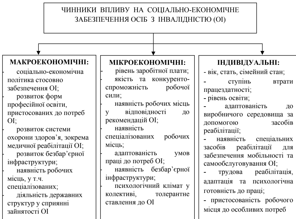
Рис. 1. Чинники впливу на соціально-економічне забезпечення осіб з інвалідністю*

ВИКЛАД ОСНОВНОГО МАТЕРІАЛУ ДОСЛІДЖЕННЯ. Приймаючи до уваги, що мотивація – це сукупність рушійних сил (внутрішніх та зовнішніх), які спонукають людину до виконання певних (свідомих і несвідомих) дій, вчинків, то мотивація соціально-економічного забезпечення – це сукупність внутрішніх та зовнішніх мотивів поведінки людей при соціально-економічному забезпеченні (рис.1).