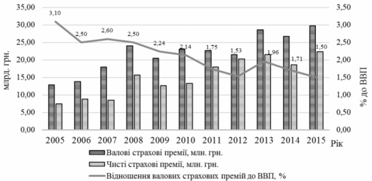
Рис. 1. Динаміка страхових премій та відношення валових страхових премій до ВВП за період 2005-2015 рр. в Україні [1]

Показник «відношення валових страхових премій до ВВП» є найбільш важливий показник, що дає оцінку впливу страхування на соціально-економічний розвиток країни. Його оптимальне значення відповідно до методики розрахунку рівня економічної безпеки 2013 року становить 1-8 %. Хоча значення цього показника і відповідають нормі протягом досліджуваного періоду, проте є низьким, адже у розвинутих країнах частка страхування у ВВП складає до 10 % [3]. Підвищення рівня проникнення страхування в економіку держави можливе і за рахунок удосконалення механізму СПТД. Таким чином, нарощення страхових премій вітчизняними страховими компаніями повинно відбуватись і за рахунок значного збільшення СПТД.