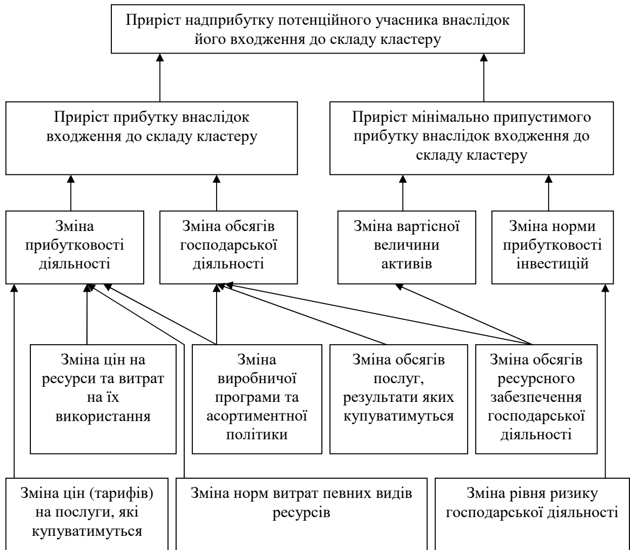
Рис. 2. Модель взаємозв'язків між чинниками, які обумовлюють економічну ефективність утворення транскордонного кластеру