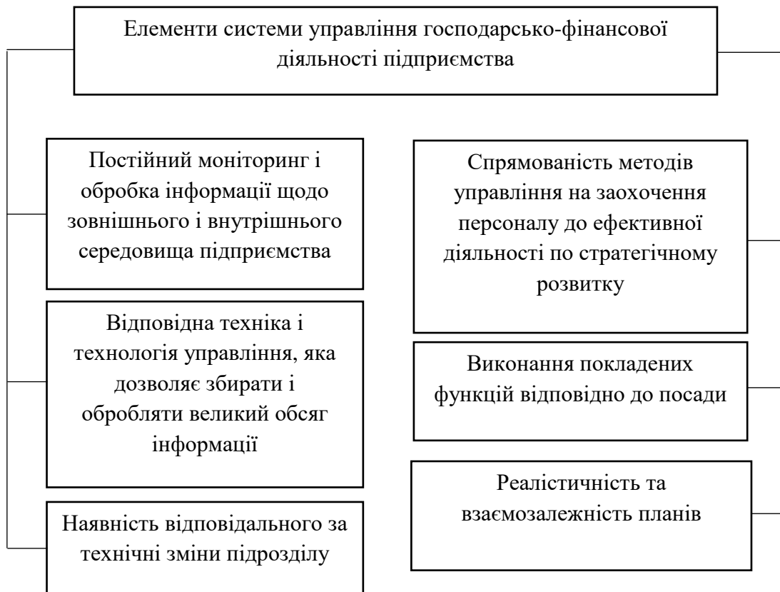
Рис. 1. Елементи системи управління господарсько-фінансової діяльності підприємства

В науковій роботі Щербань О. Д. зосереджено увагу на трьох основних напрямках, які забезпечують подолання проблем ефективності діяльності підприємства. Комплексне використання даної системи забезпечить відповідні темпи зростання ефективності виробництва [7, с. 259]. Враховуючи усе вищесказане можна виділити ряд проблем, що призводять до зниження ефективності господарсько-фінансової діяльності підприємства (рисунок 2).