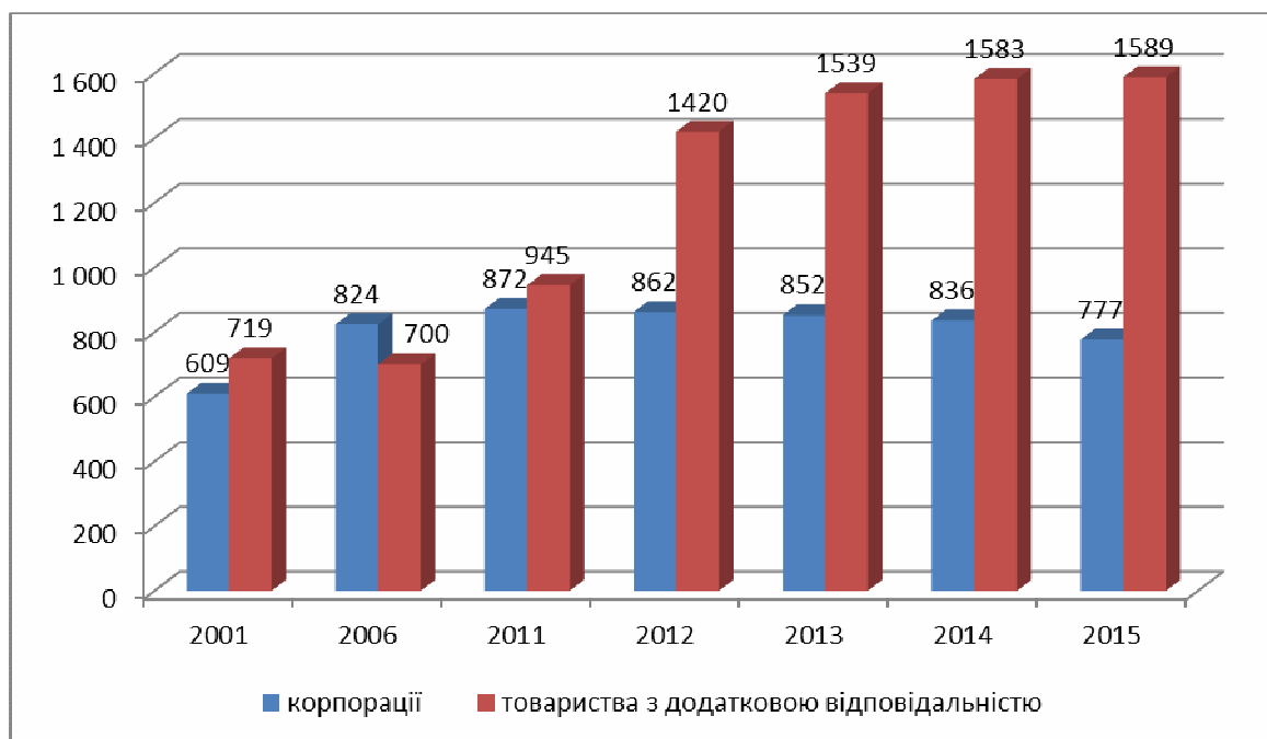
Рис. 2. Динаміка корпорацій та товариств з додатковою відповідальністю протягом 2001 – 2015 рр. (на початок року) [9, с.68]

компанії. На захист другого підходу зазначається, що теорія організації лише висвітлює та структурує сам об'єкт управління, в той час як на питання як керувати – відповідає вже наука про управління [7, с. 7].