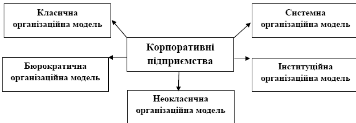
Рис. 3. Вірогідні організаційні моделі корпоративних підприємств

В теорії організації розглядаються такі організаційні моделі підприємств: класична або механістична (Тейлор Ф., Файоль А., Муні Д.), бюрократична (Вебер М.), неокласична або органічна, інституційна та системна (рис.3).