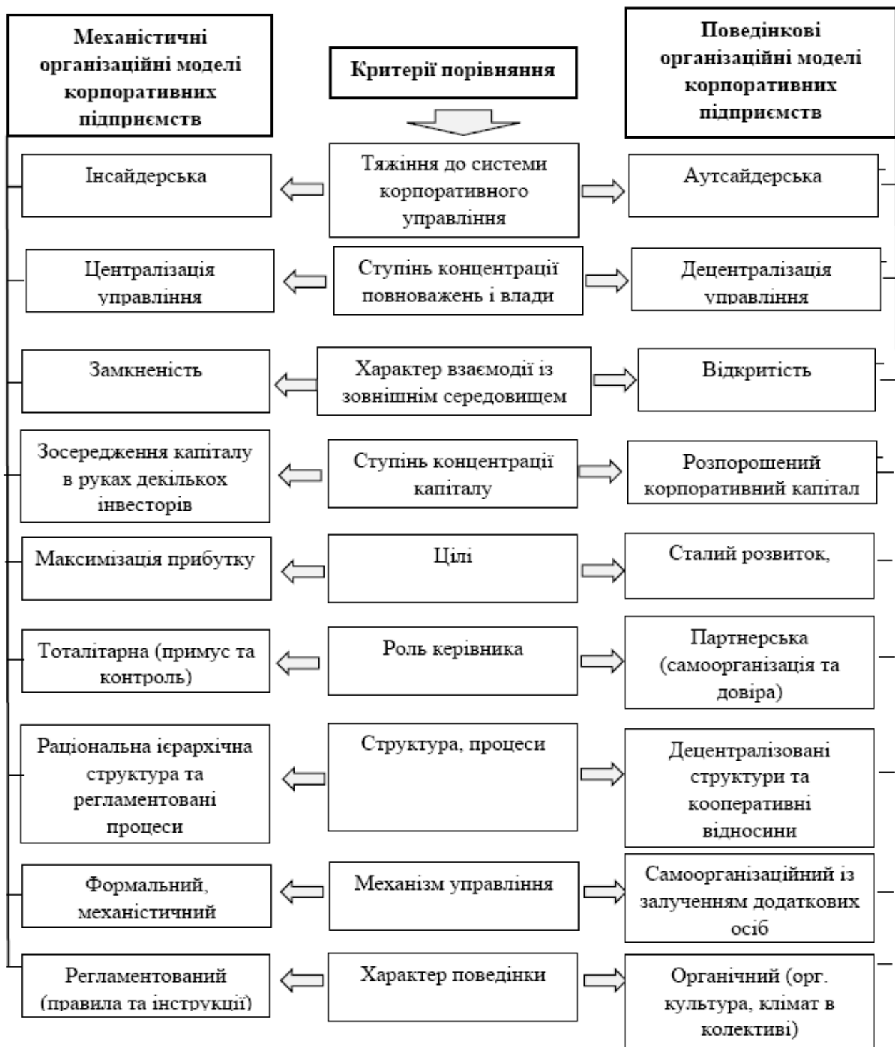
Рис. 4. Порівняльна характеристика механістичних та поведінкових організаційних моделей корпоративних підприємств

На наш погляд, повною мірою віддзеркалює сутність корпоративних підприємств системна організаційна модель, оскільки вона є найбільш гнучка та універсальна, найкращим чином відповідає мінливим ринковим умовам, уособлює в собі одночасно раціональні і поведінкові організаційні процеси в середині підприємств. На базі системної організаційної моделі досягнення цілей відбувається під впливом як централізованих розпоряджень, так і на основі неформального пристосування до вирішення нагальних проблем. Водночас, системна організаційна модель передбачає відкритість до взаємодії із зовнішнім середовищем, а також враховує соціальні аспекти побудови ефективного та конкурентного підприємства.