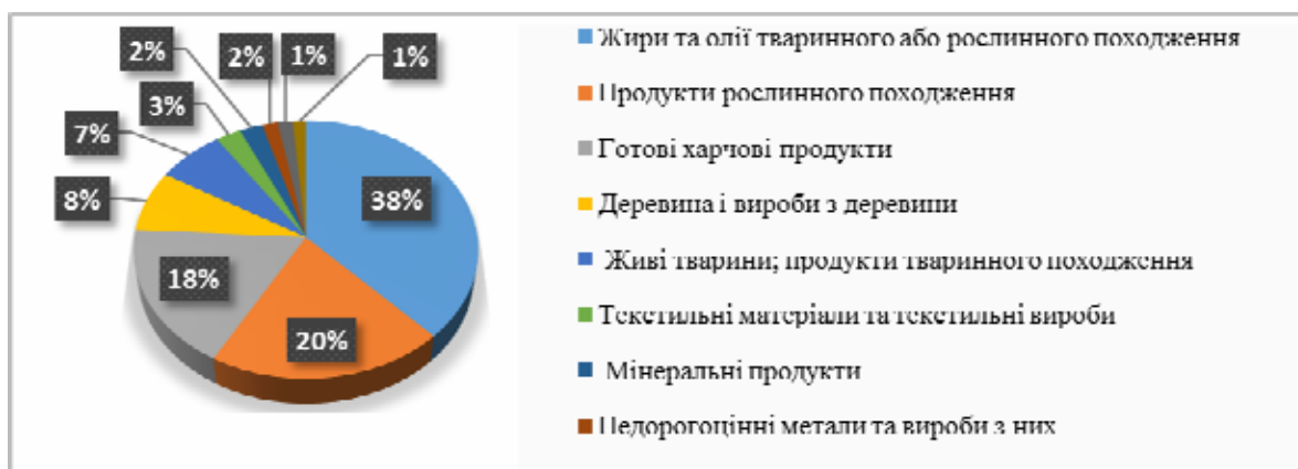
Рис. 3. Основні групи товарів згідно з УКТЗЕД, що експортувалися підприємствами Вінницької області у 2017 році

Конкурентоспроможність підприємств Вінницької області на зовнішньому ринку визначається обсягом експорту регіону за певними видами продукції. Так, згідно даних 2017 року у структурі експорту підприємств Вінниччини переважають такі групи товарів як: жири та олії тваринного або рослинного походження, продукти рослинного походження, готові харчові продукти, деревина та вироби з деревини, продукти тваринного походження. До частки експорту підприємств досліджуваного регіону також належать текстильні матеріали та текстильні вироби, мінеральні продукти, недорогоцінні метали, машини, обладнання та механізми, продукція хімічної промисловості (рис. 3).