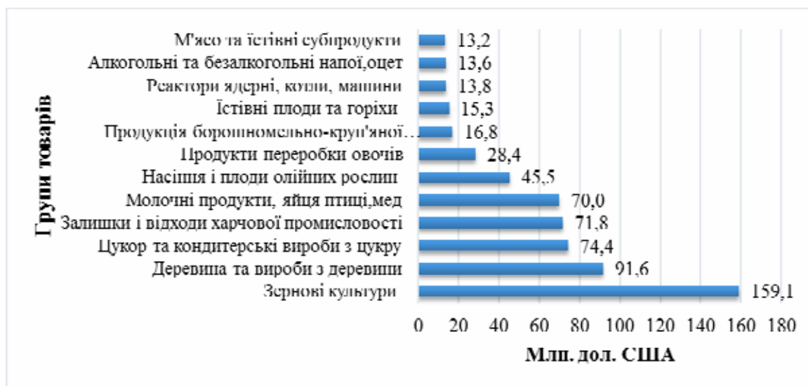
Рис. 4. Основні товари, які експортувалися підприємствами Вінницької області у 2017 році

За даними Головного управління статистики у Вінницькій області протягом досліджуваного періоду виробники даного регіону найбільше експортували: зернові культури (159,1 млн. дол. США), деревину та вироби з деревини (91,6 млн. дол. США), цукор та кондитерські вироби з цукру (74,4 млн. дол. США), залишки і відходи харчової промисловості (71,8 млн. дол. США), молочні продукти, яйця птиці, мед (70 млн. дол. США) (рис.4).