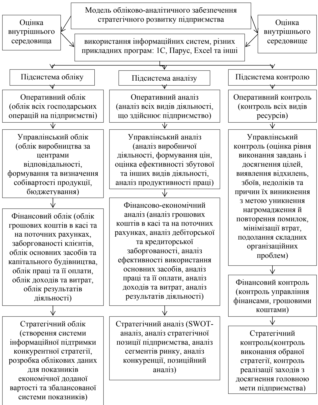
Рис. 2. Модель обліково-аналітичного забезпечення стратегічного розвитку підприємства

З представленого рисунку бачимо, що модель обліково-аналітичного забезпечення стратегічного розвитку підприємства має включати оцінку внутрішнього та зовнішнього середовища. Крім того, формування обліково-аналітичного забезпечення стратегічного розвитку підприємства здійснюється за допомогою обліку, аналізу та контролю на наступних рівнях: оперативному, управлінському, фінансовому, стратегічному.