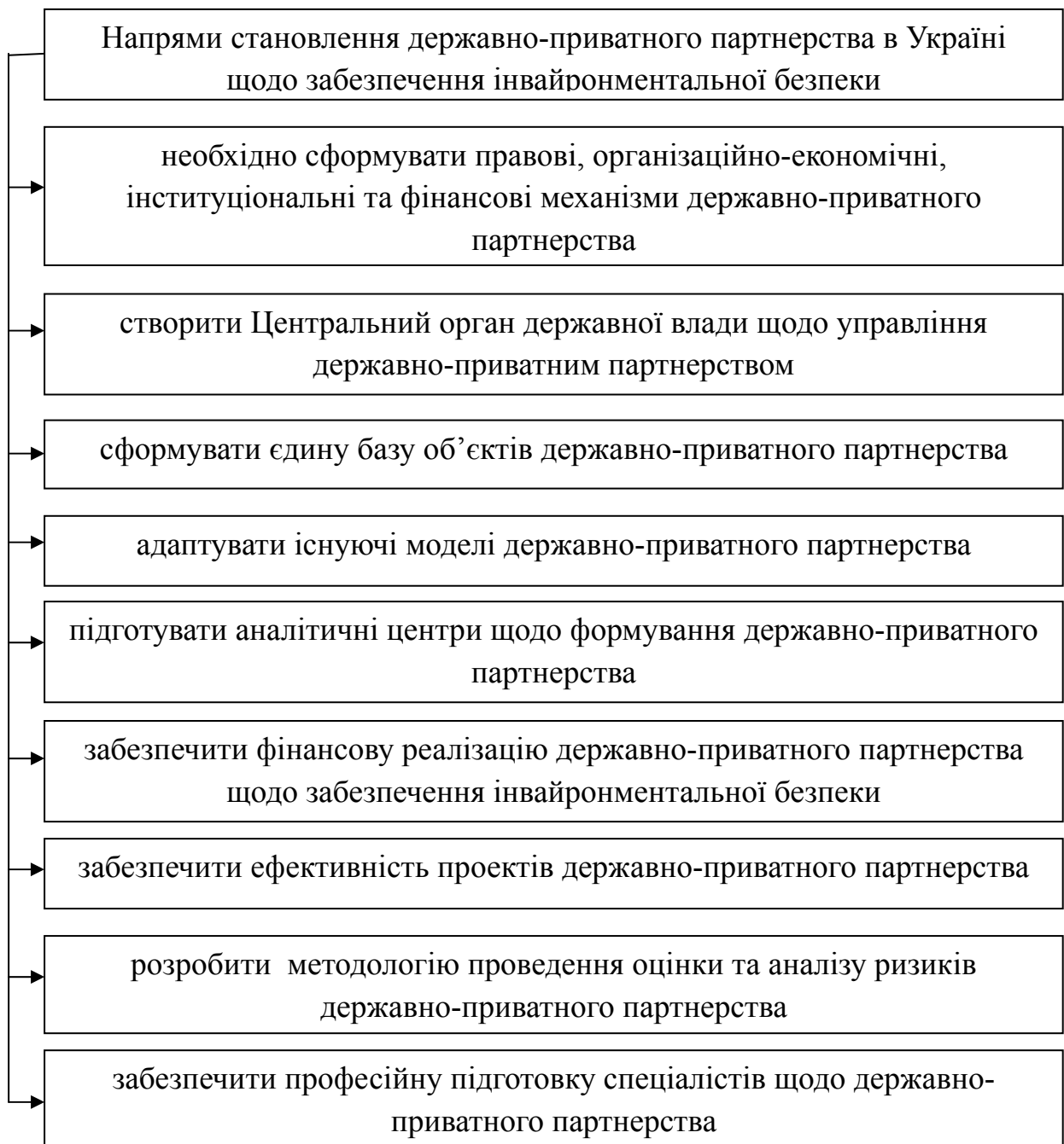
Рис. 2. Основні напрями становлення державно-приватного партнерства в Україні щодо забезпечення інвайронментальної безпеки

Важливого значення державно-приватне партнерство набуває у розрізі забезпечення інвайронментальної безпеки. Державно-приватне партнерство дозволить розділити функції щодо забезпечення інвайронментальної безпеки між державою та підприємством.