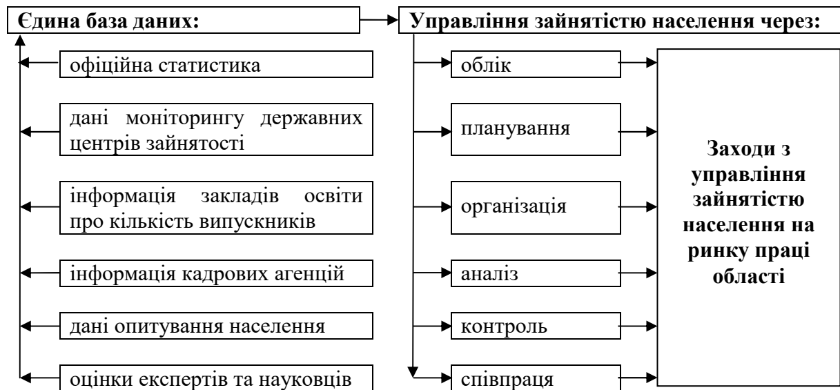
Рис. 5. Інформаційне забезпечення процесу управління зайнятості населення на рівні області

Крім того, це сприятиме покращанню іміджу та зростанню довіри населення до різних суб'єктів управління через достовірність інформації. Інформаційне забезпечення процесу управління зайнятості населення може мати схему, що показана на рисунку 5.