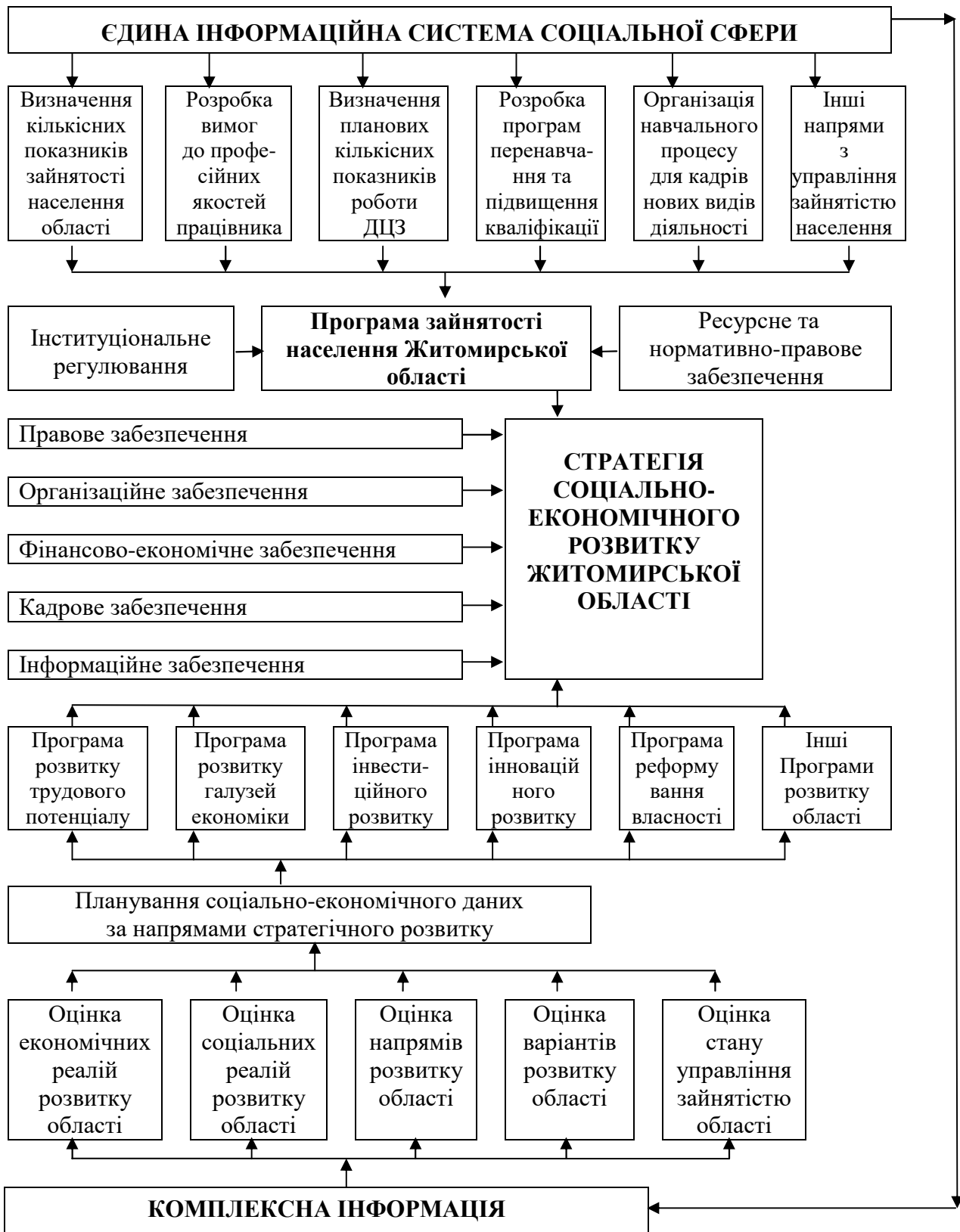
Рис. 6. Структурно-логічна схема процесу управління зайнятістю населення в контексті стратегічного розвитку Житомирської області