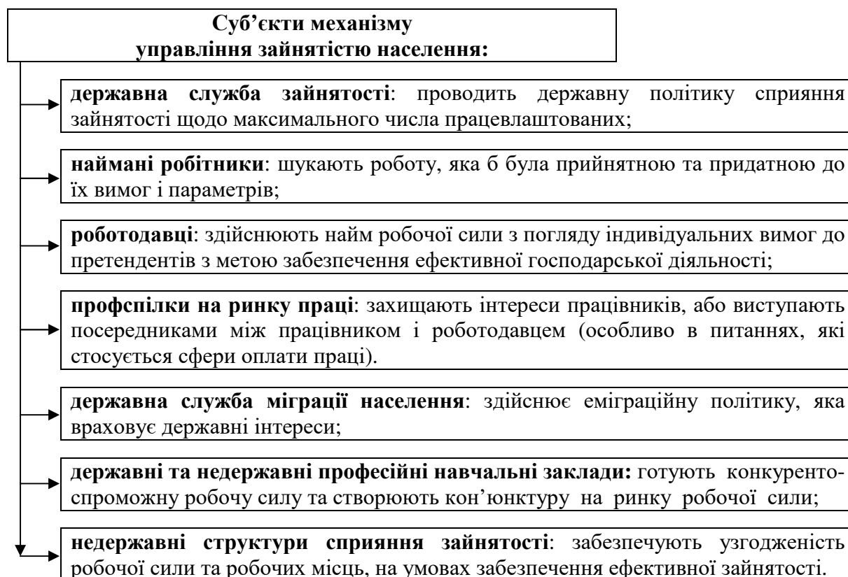
Рис. 4. Суб'єкти механізму управління зайнятістю населення

При дослідженні сфери зайнятості населення області ми зіткнулися з наявністю значних розбіжностей між офіційною та неофіційною інформацією, які продиктовані недосконалістю системи їх отримання: збирання, обробки та оприлюднення офіційної статистики; недостовірність даних про вакантні робочі місця, що надаються роботодавцями. Використання узагальненої інформації дозволить досягти найбільшої ефективності у процесі управління зайнятістю населення в області, оскільки вона дає можливість оцінити реальну ситуацію на ринку праці області, визначитися з причинами розбіжностей в даних. Тому, пропонуємо на базі Житомирського обласного центру зайнятості спільно з Департаментом соціального захисту населення Житомирської обласної державної адміністрації запровадити «єдину інформаційну систему соціальної сфери», складовою якої буде інформація і щодо сфери зайнятості населення. Дана інформаційна система на основі інформаційної взаємодії різних суб'єктів має передбачати збір, обробку та оприлюднення інформації щодо всього соціального напрямку регіону, а головне – вона була б максимально достовірною. Так, наприклад, суб'єкти механізму управління зайнятістю населення при формуванні своєї інформації мають на меті різні її функції, мету та задачі (рис. 4).