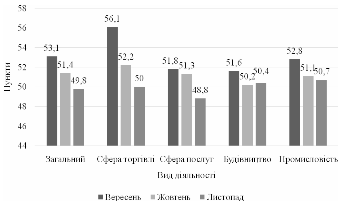
Рис. 4. Динаміка індексу очікувань ділової активності підприємств за вересень-листопад 2021 р.

Нижче розглянемо загальні та секторальні значення індексу очікувань ділової активності за останні три місяці (рис. 4).