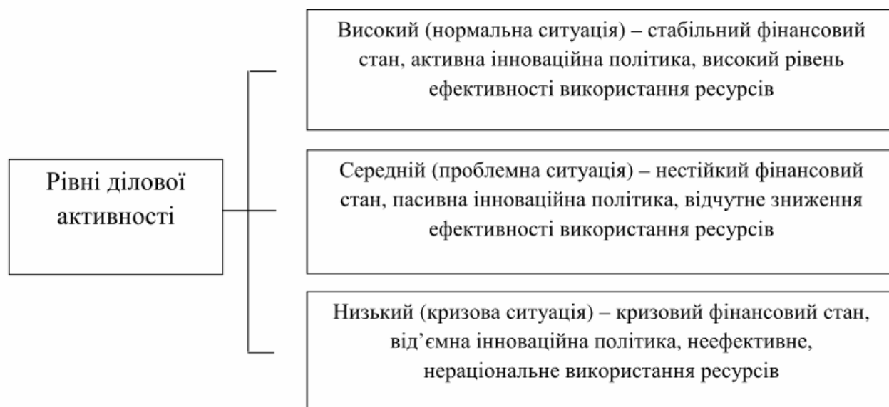
Рис. 1. Характеристика рівнів ділової активності підприємства

Так як результати аналізу ділової активності є важливою складовою у розробці заходів щодо забезпечення діяльності підприємства, доцільно оцінювати рівень ділової активності. Характеристики рівнів ділової активності наведено на рис. 1.