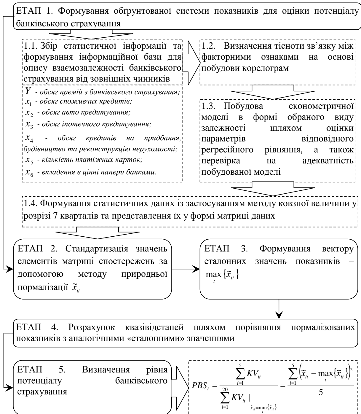
Рис. 1. Науково-методичний підхід до оцінювання рівня банківського страхування в Україні

Отже, детально розглянемо сутність кожного із зазначених етапів визначення рівня потенціалу банківського страхування, враховуючи тенденції розвитку ринку банківських послуг, на основі застосування методів економетричного моделювання.