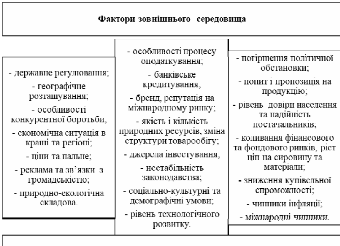
Рис. 2. Зовнішні фактори впливу на стратегічне управління оборотними активами [7, с. 32]

Специфічними факторами впливу є: збої у виробничому процесі, застаріле обладнання, форми стимулювання праці, кваліфікація трудових ресурсів, удосконалення організації праці, впровадження нових технологій тощо [7, с. 33].