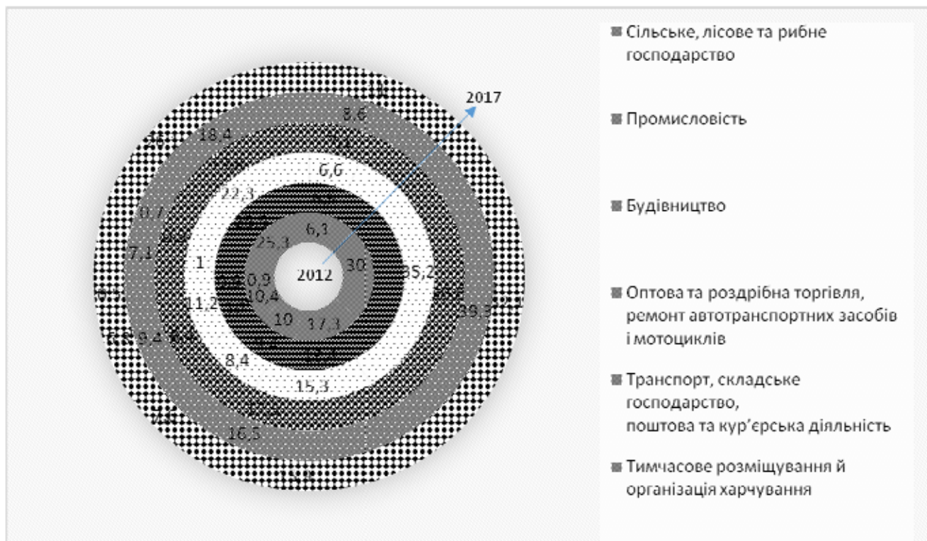
Рис. 2. Графічна інтерпретація капітальних інвестицій за видами економічної діяльності у відсотках до загального обсягу за період 2012-2017 роки.

Джерело: складено за даними Державної служби статистики України