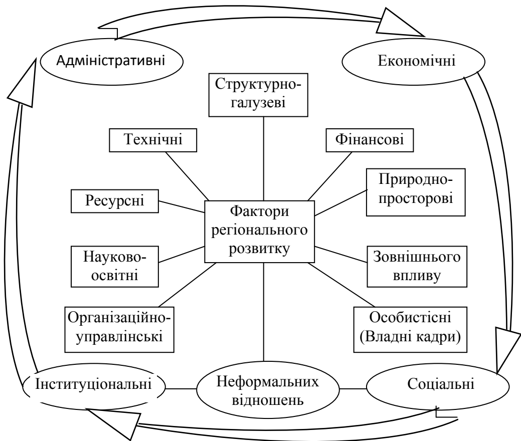
Рис. 1. Система факторів регіонального розвитку

Зрозуміло, що пріоритет в цьому балансі має «стійкий» або «сталий розвиток». Само поняття «розвиток» досить часто доповнюється таким поняттями як «збалансований», «гармонійний», «адаптивний». Отже, розвиток потребує узгодження соціального, економічного та екологічного процесів як єдиного цілого та за вимогами збереження зовнішнього середовища.