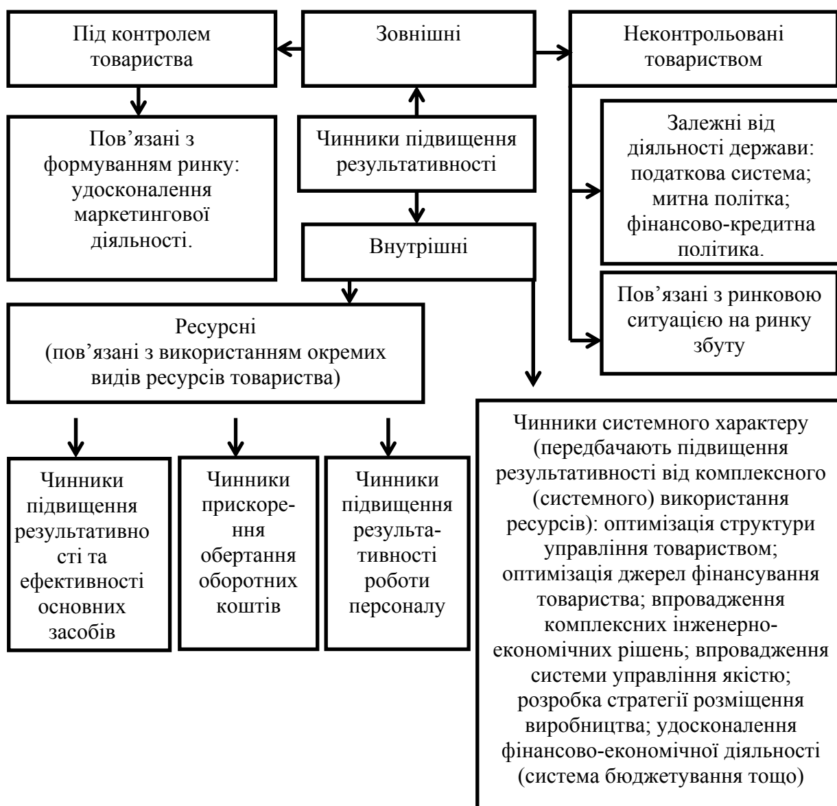
Рис. 2. Чинники підвищення результативності діяльності ПрАТ «Фірма «Полтавпиво»

діяльності. Це зумовлює виділення серед чинників підвищення результативності діяльності групи неконтрольованих товариством чинників (рис. 2).