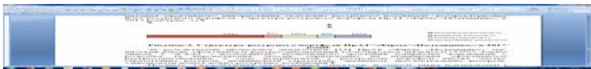
Рис. 3. Структура ресурсного портфеля ПрАТ «Фірма «Полтавпиво» в 2017 році

По-перше, в контексті підвищення результативності діяльності актуальними є питання ефективного використання складових ресурсного потенціалу, реструктуризації його ресурсного портфеля. Структура ресурсного портфеля ПрАТ «Фірма «Полтавпиво» в 2017 році (рис. 3).