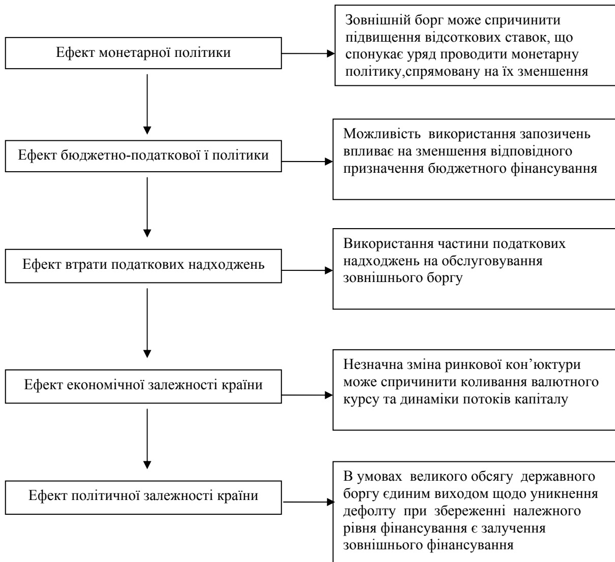
Рис. 1. Макроекономічні ефекти державного боргу

Залежно від характеру наслідків впливу державного боргу на фінансову безпеку, їх поділяють на короткострокові та довгострокові.