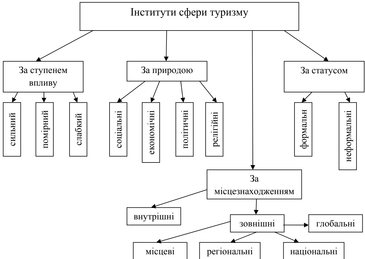
Рис. 2. Елементи інституційного середовища в туристичній сфері*

Наведена система критеріїв, у випадку свого комплексного застосування, дозволяє не тільки провести ідентифікацію елементів інституційного середовища конкретного об'єкту туристичної діяльності, а й визначитися із потенційною стратегією щодо співпраці із ними. Слід зазначити, що методологічною базою з напрямків інституційного аналізу сучасних особливостей функціонування туристичної галузі як складної багатокладної системи є теорія стейкхолдерів.