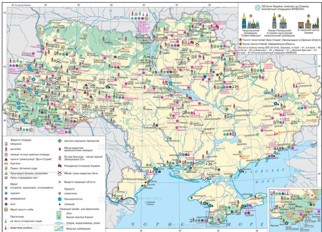
Рис. 3. Наявна туристична інфраструктура України Джерело [3]

Висновки. Тож варто зазначити, що викладених вище матеріалів, можна зробити висновок, на території України є достатньо потужний потенціал для створення туристичної інфраструктури, що включатиме в себе важливий напрямок розвитку санаторно-курортної галузі в Україні. Саме санаторно-курортні послуги на сьогодні є важливим напрямком лікування та реабілітації учасників АТО та жителів прифронтових територій, які потребують як психологічної так і медичної підтримки. Завдяки розвитку внутрішньому туризму між регіонами сприятиме культурному обміну розвитку інфраструктури та розвитку того регіону де буде діяти туристичний маршрут котрий буде включати в себе всі види туризму, зокрема який розташований на сільських територіях.