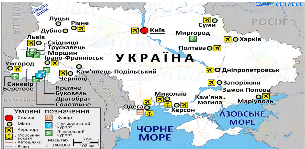
Рис. 1. Інфраструктура для розвитку туризму та курортів України

На рисунку 1 можна спостерігати можливий розвиток туристичної інфраструктури на сільських територіях де частково вона вже існує.