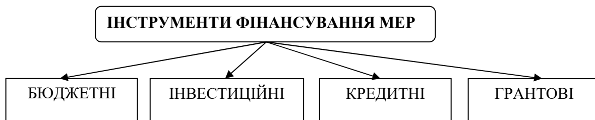
Рис. 1. Класифікація інструментів фінансування МЕР

Успіх економічного розвитку громади залежить від здатності місцевих органів влади реалізовувати політику МЕР, від наявності достатніх ресурсів та їх ефективного використання для забезпечення життєдіяльності громади, від відповідної інституційної підтримки усіх перетворень, що відбуваються в громаді. Будь-який вид економічної політики незалежно від рівня її реалізації (державний чи місцевий) залежить від механізму реалізації. Базовим елементом терміну “механізм реалізації політики МЕР” є поняття самого механізму. Загальновідомо, що механізми є різні за конструкцією і призначенням, становлять основу більшості машин, пристроїв і приладів. В економічній науці поняття “механізм” вживається у переносному значенні і означає “внутрішню будову, систему чого-небудь”. Тому “механізм реалізації політики МЕР” можна трактувати як внутрішню будову політики МЕР, систему основних її елементів (суб'єкти, об'єкти, цілі, інструменти та індикатори). Враховуючи те, що метою нашого дослідження є встановити взаємозв'язок між податковим стимулюванням і МЕР, зупинимось детальніше на інструментах фінансування МЕР, як важливих елементах механізму реалізації політики МЕР (рис.1.) [7, с.96].