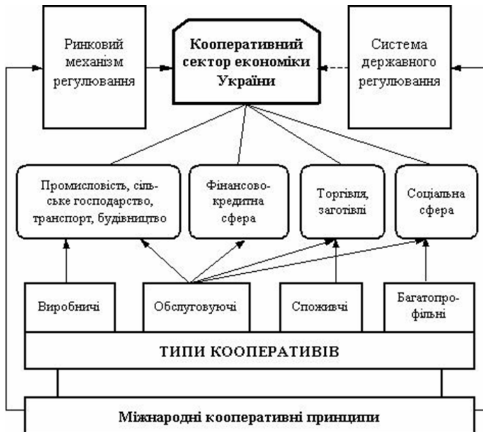
Рис. 1. Система кооперації в Україні [14,С. 39]

Попередній досвід розвитку споживчої кооперації в Україні, яка займала центральне місце в організації торгової діяльності в сільській місцевості показав що за роки незалежності статус таких підприємств дуже знизився.