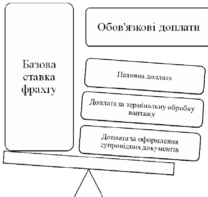
Рис. 1. Складові елементи вартості перевезення на фрахтовій біржі

Разом з основною ставкою фрахтувальник має сплатити ще й обов'язкові доплати. Виокремлення обов'язкових доплат в окремі складові ціни викликані тим, що судовласник не може передбачити на етапі укладання договору коливання цін на супутніх етапах доставки вантажу і у зв'язку з цим ризики значних змін розподіляються з замовником. Крім того, що це дозволяє розподілити ризики між замовником і виконавцем, дане ціноутворення є більш прозорим для замовника і дозволяє обирати на ринку виходячи з вартості самого перевезення (ігноруючи накладні витрати, розмір яких може ввести в оману на етапі прийняття рішення).