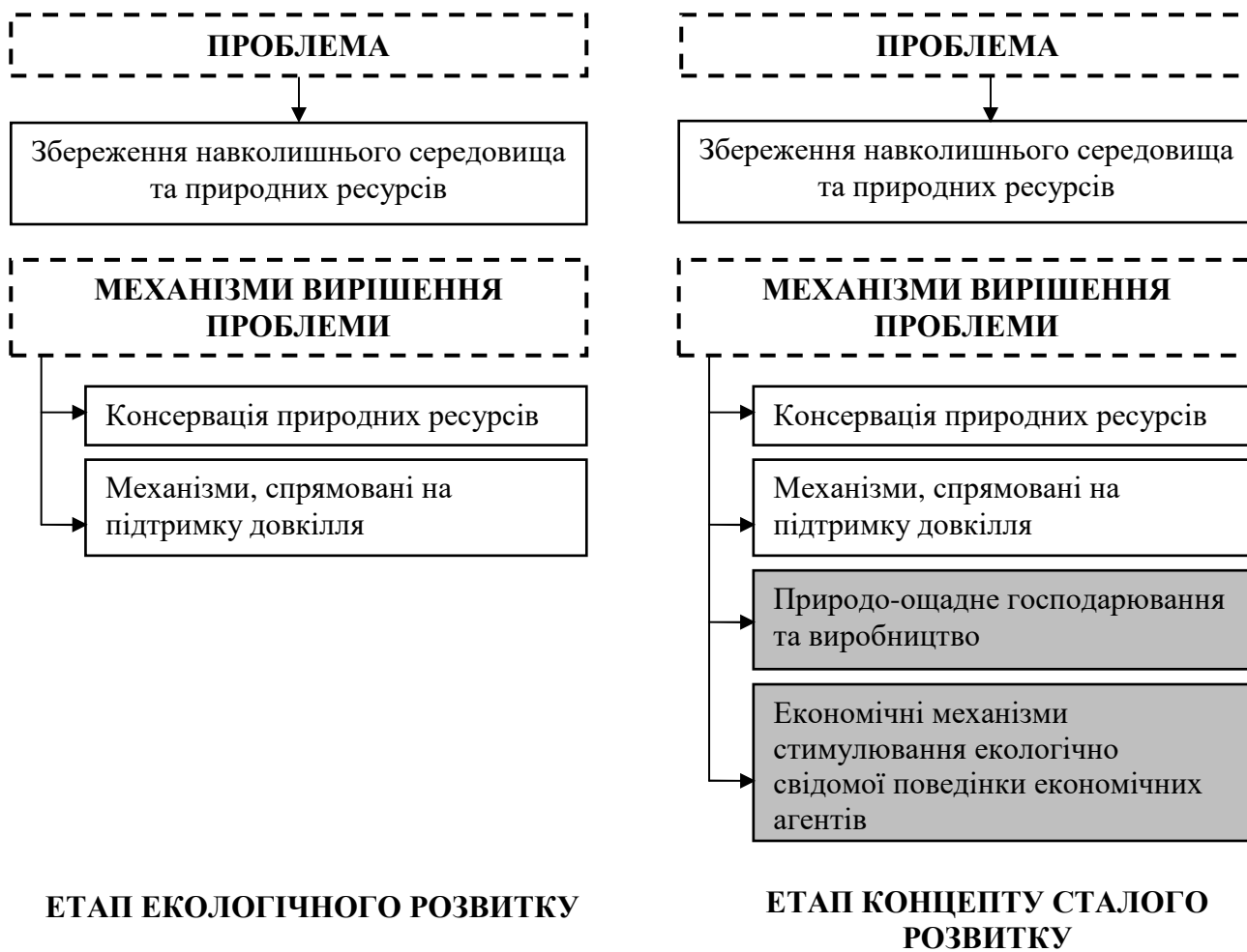
Рис. 3. Основна проблема та механізми її вирішення у концепції екологічного розвитку 1972 р. та концепції сталого розвитку 1987 р.

Якщо раніше зазначені два періоди еволюції проблем сталого розвитку з 1972 до 1992 р.р. віддзеркалили достатньо активну трансформацію від фокусу навколо екологічних проблем до появи нового концепту сталого розвитку, то наступні чотири етапи з 1992 р. й дотепер характеризуються визначенням та триазовим переглядом проблем та цілей сталого розвитку.