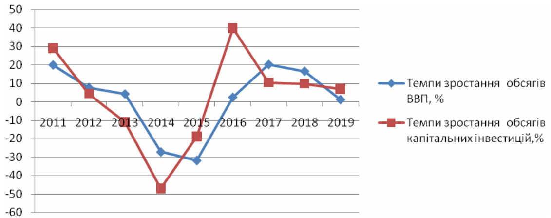
Рисунок 1. Динаміка темпів зростання ВВП та обсягу капітальних інвестицій в Україні за 2011-2019 рр.

Проаналізуємо також динаміку темпів зростання обсягу ВВП та величини капітальних інвестицій Німеччини та Польщі (рис. 2 та рис. 3).