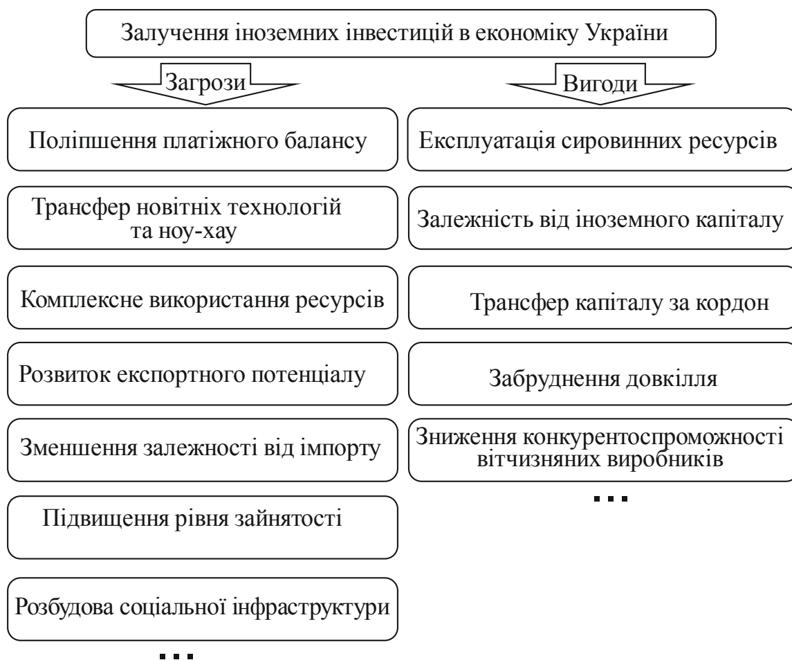
Рис. 1. Переваги та загрози зовнішнього інвестування (Розроблено авторами на основі [6 – 9] )

Слід сказати, що вигоди та загрози від іноземних інвестицій тісно пов'язані між собою. На рисунку 2 представлено деякі з таких зв'язків. Тому здається, що для кожної конкретної ситуації або в кожному конкретному економічному періоді слід проводити прикладні дослідження за спеціальною методикою визначення переваг застосування іноземних інвестицій перед загрозами іноземного інвестування. Створення такої методики, призначеної для будь-яких умов господарювання не лише в Україні, а також її апробація є перспективними напрямками науково-прикладних досліджень авторів.