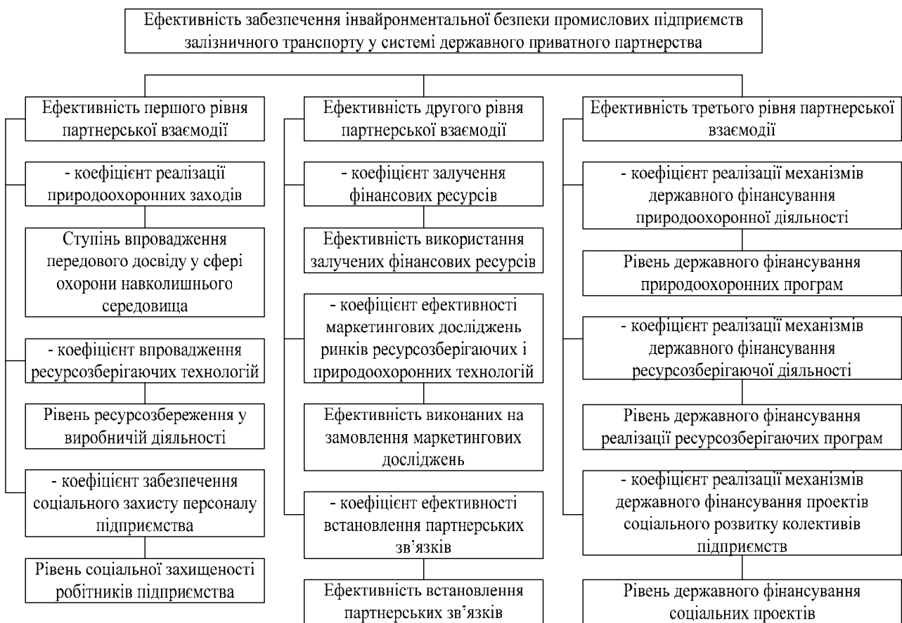
Рис. 1. Методичний підхід до визначення ефективності державно-приватного партнерства у сфері забезпечення інвайронментальної безпеки промислових підприємств залізничного транспорту

E_{\text{ЗІБ}}^{III} – ефективність партнерської взаємодії на третьому рівні (взаємодія з державою).