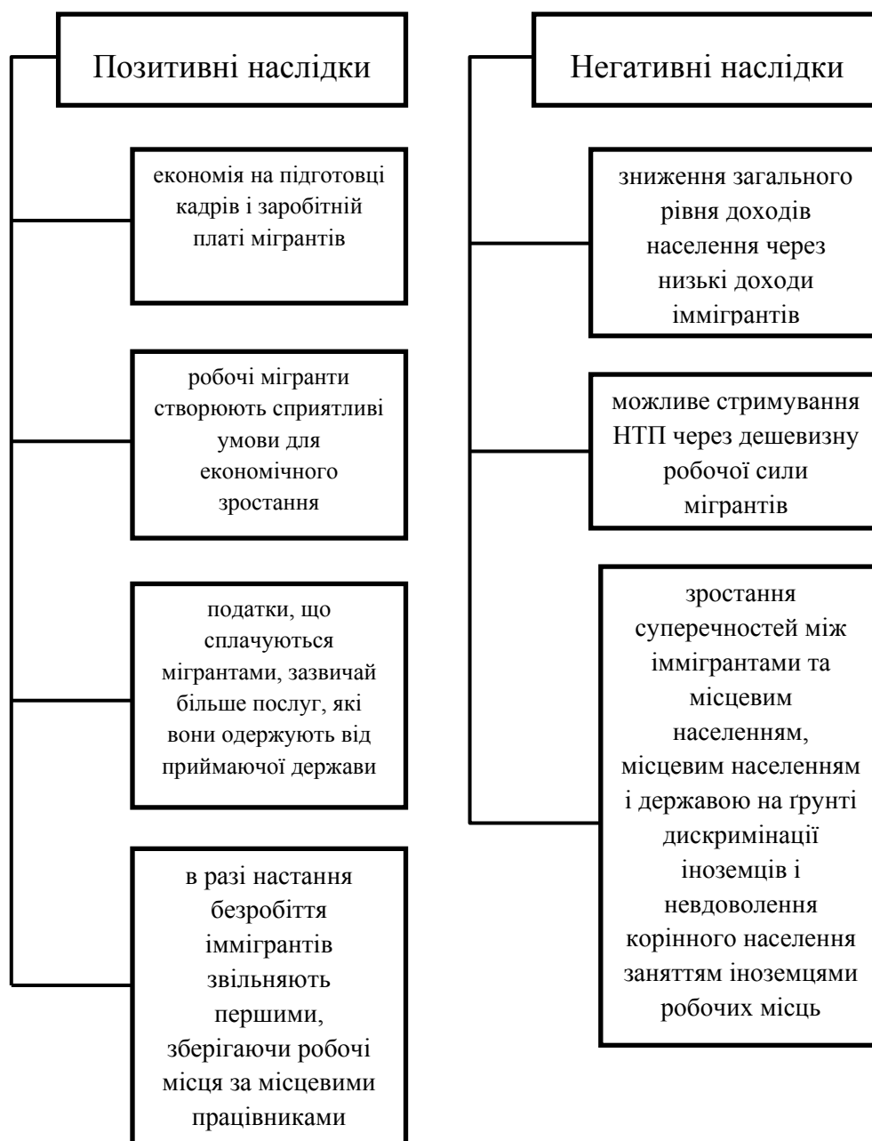
Рис. 4. Наслідки трудової міграції для країни-донора

Також, в рамках проведених в країнах зі значною кількістю мігрантів ряду досліджень робляться нерідко прямо протилежні висновки при зіставленні вигоди й втрат від міграції трудових ресурсів. Причина в тому, що вона призводить до вельми суперечливих соціально-демографічних і соціально-економічних наслідків. До числа соціально-демографічних наслідків слід віднести зміни, які виникають в чисельності та структурі населення (статевовіковому, соціальному та національному складі), а також на рівні напруженості соціальних відносин й криміналізації суспільства; соціально-економічні наслідки пов'язані зі змінами структури господарського ладу країни, чисельності та структури трудових ресурсів (освітнього та професійно-кваліфікаційного складу), рівня демографічного навантаження на працездатне населення, стану ринку праці та ефективності використання трудових ресурсів.