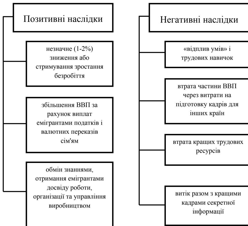
Рис. 3. Наслідки трудової міграції для приймаючої країни

Позитивні і негативні наслідки трудової міграції для країн-реципієнтів представлені на рисунку 3.