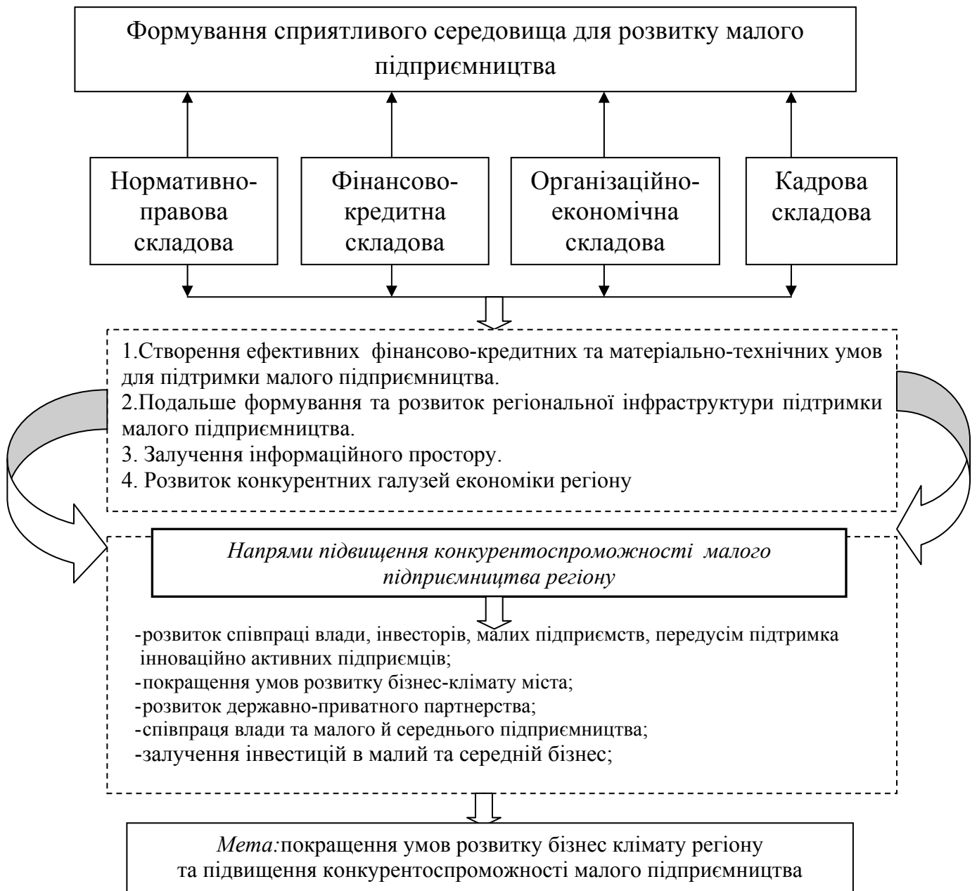
Рис. 2. Механізм підвищення конкурентоспроможності малого підприємництва Миколаївського регіону

Важливим завданням являється визначення перспективних видів діяльності для суб'єктів малого підприємництва Миколаївського регіону, як передумови підвищення їх конкурентоспроможності. Одним з важливих і пріоритетних видів економічної діяльності Миколаївського регіону є транспортний комплекс, який забезпечує потреби народного господарства та населення і являється важливим фактором реалізації її значного і вигідного геостратегічного потенціалу. Миколаївська область має розгалужену транспортну систему, в структурі якої функціонує 1 міжнародний аеропорт, 4 морських порти, 1 річковий порт, підрозділи залізниць, кілька тисяч автоперевізників різних форм власності, які працюють на ринку автотранспортних перевезень. Через територію області проходять п'ять автомобільних шляхів державного значення та міжнародні автомобільні транспортні коридори. Розвиток транспортної галузі регіону відіграє важливу роль у підвищенні його конкурентоспроможності, активізації масштабного співробітництва з іншими країнами.