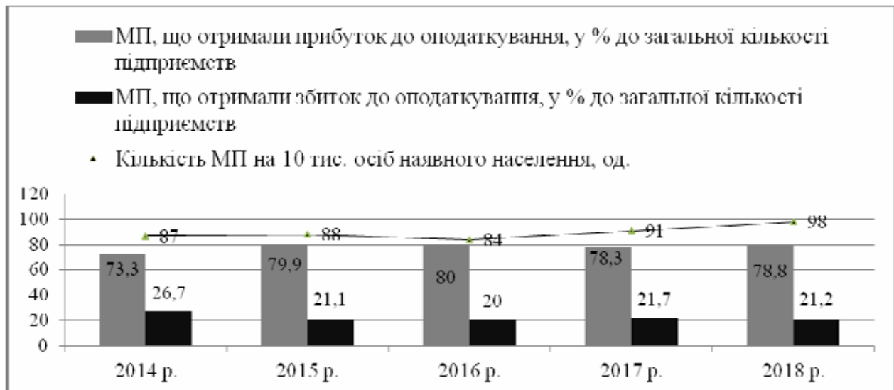
Рис. 1. Динаміка показників малого підприємництва Миколаївської області за 2014 – 2018 рр.

В Миколаївській області протягом 2014–2018 рр. частка прибуткових та збиткових малих підприємств не зазнавала істотних змін: 78,8 % становили прибуткові підприємства та 21,2 % збиткових [5]. (рис. 1).