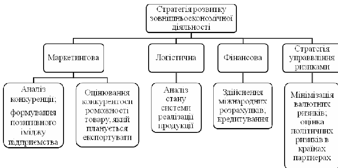
Рис. 1. Взаємозв'язок функціональних та бізнес-стратегій у системі стратегічного управління підприємства

Як правило, господарська діяльність підприємства не обмежується випуском лише одного виду продукції. Тому, визначаючи ефективність ЗЕД, необхідно врахувати різноманітність асортименту та зрушення, що відбуваються в складі товарної структури [2]. Динаміка чистого доходу від експорту ТОВ «Енерго-Ефект» представлена в табл. 1.