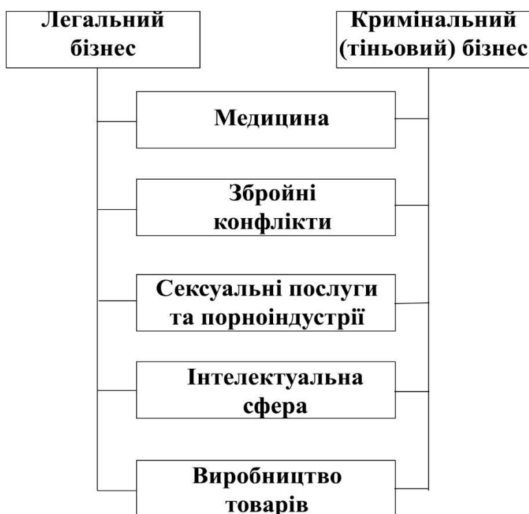
Рис. 2. Сфери інтеграції тіньового і легального бізнесу

Однією з основних проблем, які спричиняє тіньова економіка для національних економік зокрема та світового господарства в цілому, є те, що у процесі свого розвитку тіньова міжнародна діяльність поглинає і легальні сфери економіки. Прикладом може слугувати схема інтеграції та адаптації кримінального ринку торгівлі людьми у легальний ринок праці, представлена на рис. 2. Таким чином, цілком легальний прозорий бізнес поступово набуває ознак тіньового. А з розвитком глобалізації цілком можливо, що робітників на виробництві замінить нелегальна дешева робоча сила із країн третього світу.