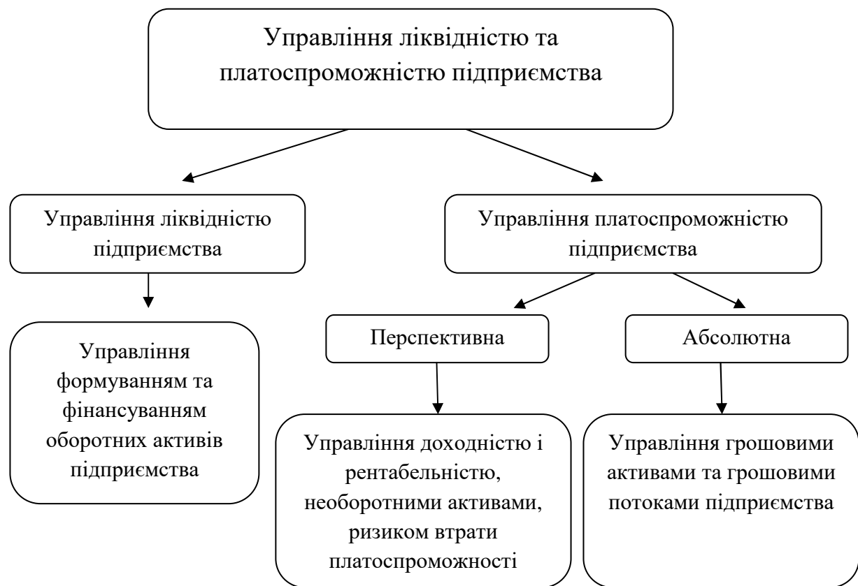
Рис. 3. Управління ліквідністю та платоспроможністю підприємства (складено автором на основі: [13])

Розробляючи політику управління ліквідністю підприємства слід враховувати стан та структуру активів підприємства, а саме співвідношення оборотних та необоротних активів. Підприємство завжди повинно обґрунтовано формувати оптимальну величину оборотних активів враховуючи критерій максимального рівня ліквідності. При цьому, при формуванні необоротних активів підприємству слід враховувати, що підприємство має забезпечити повернення інвестованих коштів найшвидше через методи прискореної амортизації і тим самим забезпечити платоспроможність підприємства в перспективі.