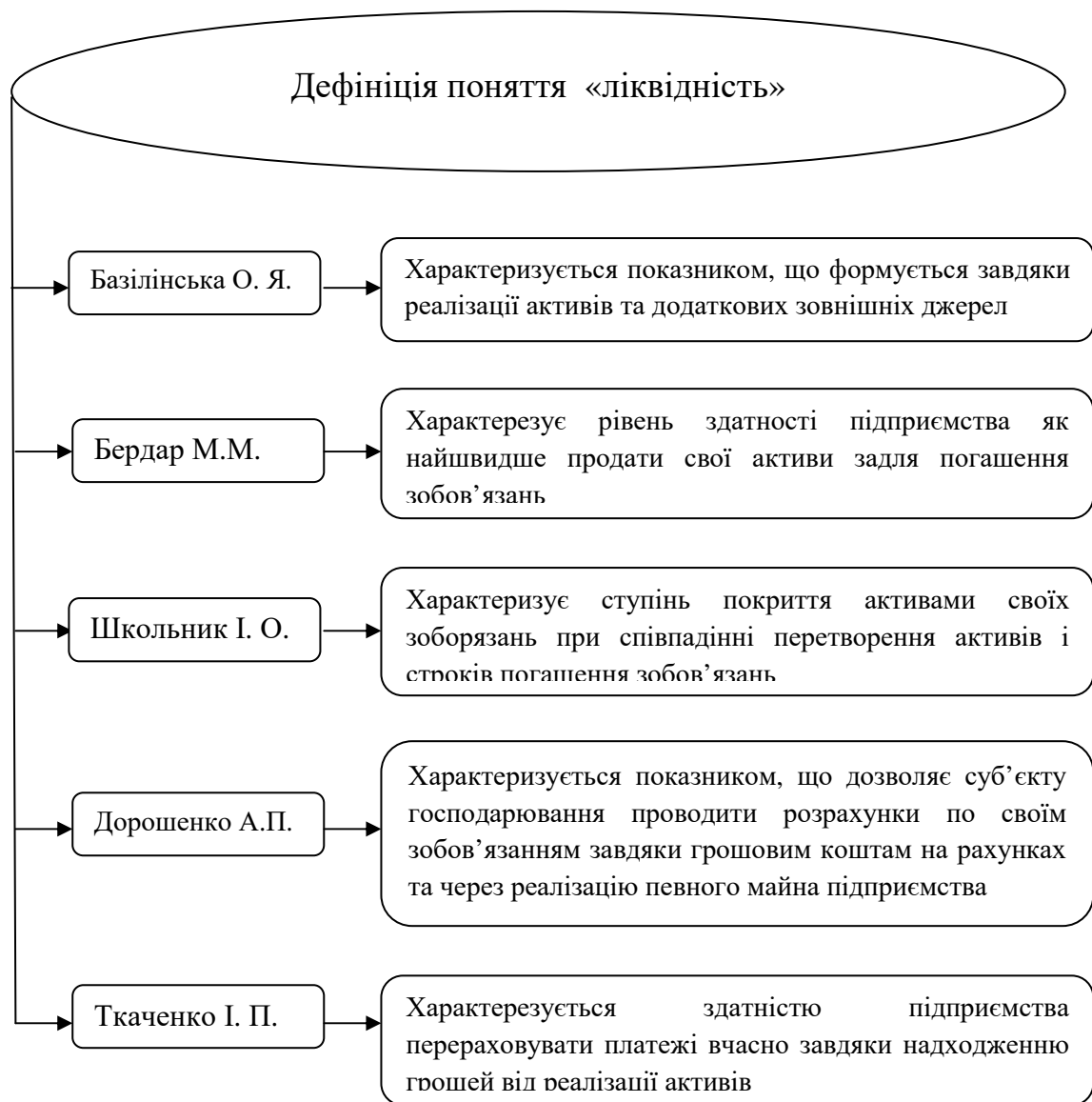
Рис. 1. Дефініція поняття «ліквідність» підприємства (складено автором на основі: [1-5])

Науковці в своїх працях по різному трактують поняття та сутність «платоспроможність» підприємства. Дефініційні понятійні судження щодо трактування «платоспроможність» підприємства представлено на рис.2.