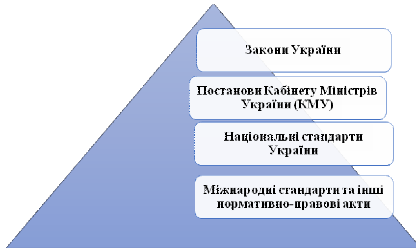
Рис. 2. Класифікація правового регулювання діяльності готельного, ресторанного та туристичного бізнесу

Враховуючи запропоновану класифікацію правового регулювання, подальший аналіз її проблемних питань готельно-ресторанного та туристичного бізнесу зосереджується на певному рівні.