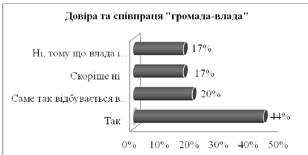
Рис. 5. Довіра та співпраця між громадою та владою

Однак, на питання «Чи вважаєте Ви можливою наявність довіри та співпраці між громадою та владою?» більшість респондентів відповіла позитивно (64%), що дає надію на світле майбутнє нашої країни (рис. 5).