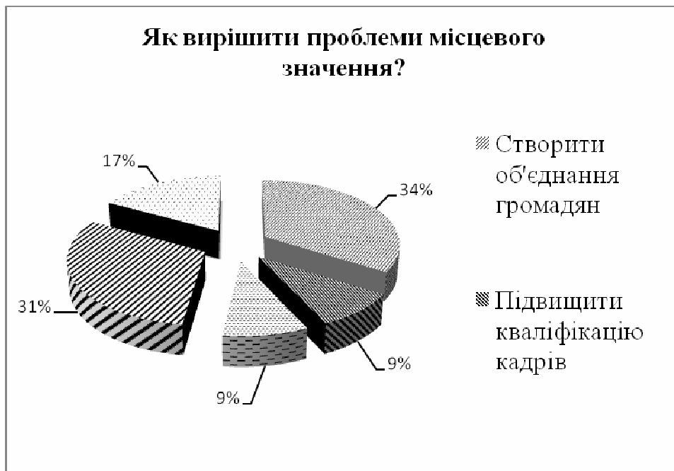
Рис. 2. Вирішення проблем місцевого значення