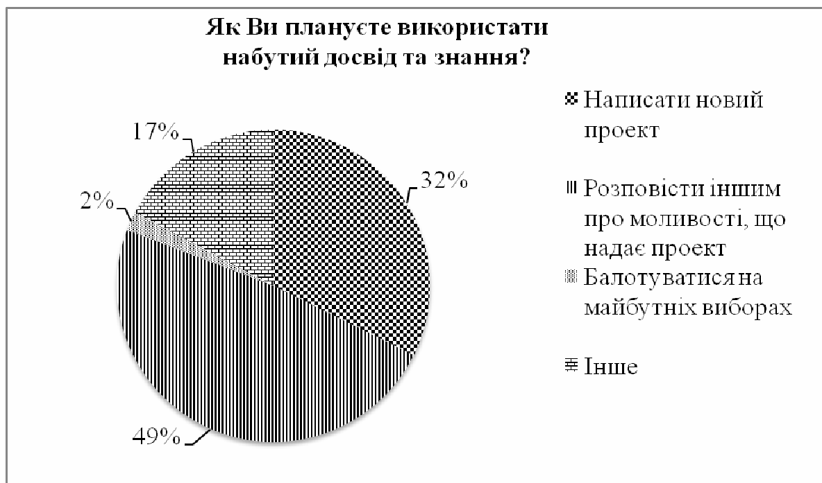
Рис. 1. Подальше використання досвіду, набутого в проекті «Місцевий розвиток, орієнтований на громаду»

Охарактеризуємо результати проведених досліджень. Хочеться звернути увагу на те, що громадяни, які беруть участь у проекті «Місцевий розвиток, орієнтований на громаду» – мають бажання писати інші проекти та ділитися цими знаннями та вміннями з іншими, чим ми підтверджуємо тезу про те, що участь в міжнародних проектах стає платформою для подальшої активної діяльності та формування спроможних громад в Україні (рис. 1).