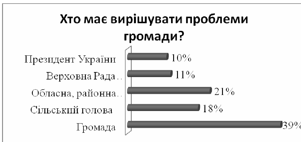
Рис. 3. Суб'єкт вирішення проблем місцевого значення на думку опитаних членів територіальних громад

Показовим результатом дослідження були відповіді на питання «Хто має вирішити проблему, що турбує громаду?» (рис. 3), де прослідковувався причинно-наслідковий зв'язок: представники громад, де дієвіше запрацював механізм співпраці «громада-влада-бізнес» – частіше обирали варіант «громада» (39%) та варіант «сільський голова», обласна, районна (тобто місцева) влада (39%); громади, де поки-що співпраця між зазначеними трьома елементами не ефективна або якась з ланок відсутня, обирали варіант «Президент України» (10%) та «Верховна Рада України» (11%), але загальний відсоток останніх був менший. Тобто, активні громади – це громади, які повірили в свої сили і в свою здатність змінювати якість життя на місцях своїми вміннями, наполегливістю та спільними зусиллями.