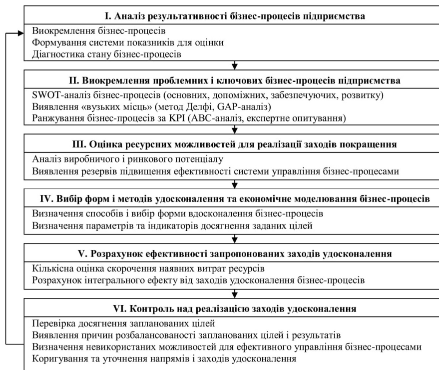
Рис. 1. Етапи оцінки управління бізнес-процесами підприємства

При здійсненні управління бізнес-процесами важливо здійснювати оцінку та аналіз бізнес-процесів. Даний процес здійснюється у декілька етапів (рис. 1).