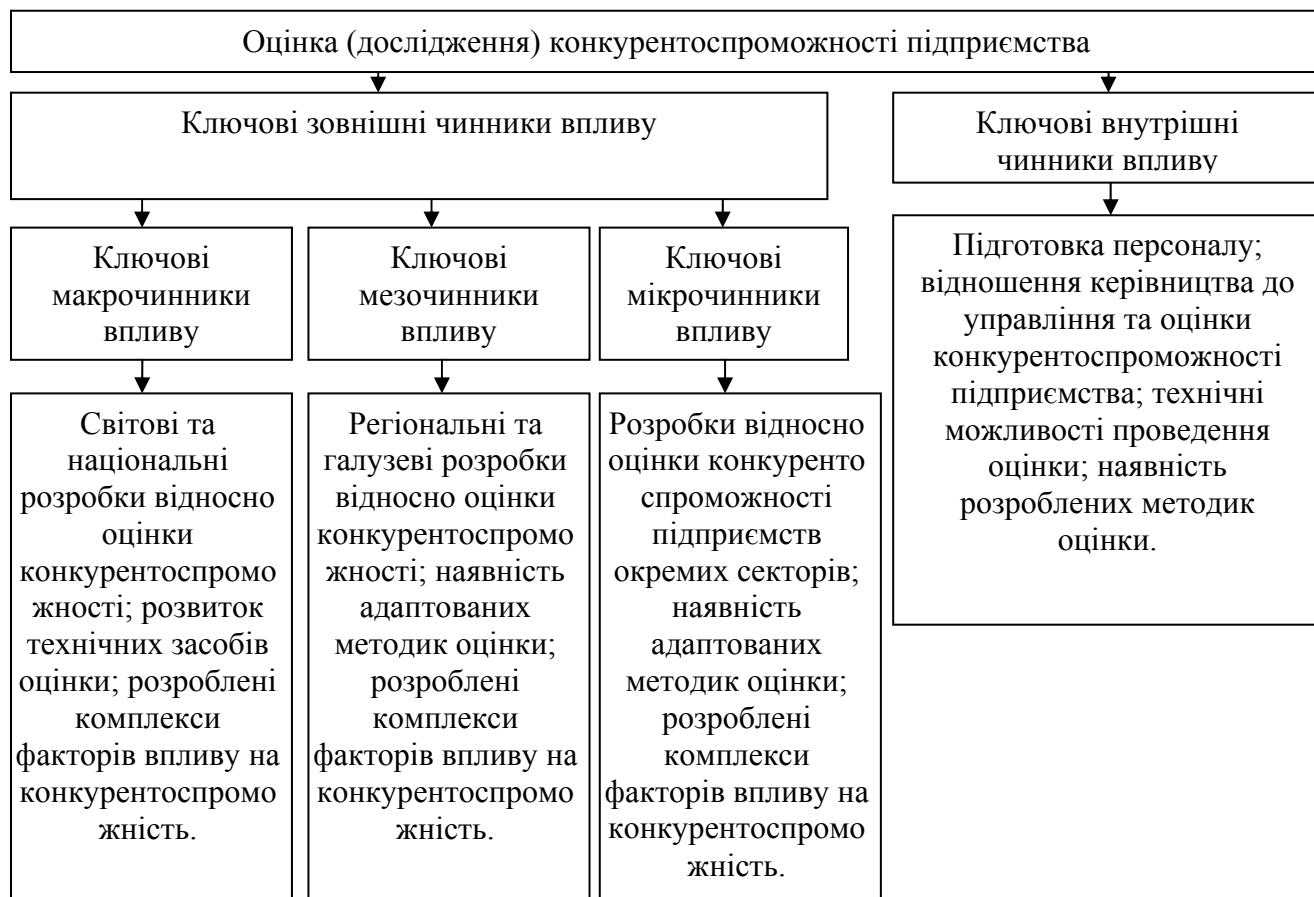
Рис. 3. Ключові чинники впливу на оцінку (дослідження) конкурентоспроможності підприємства

В межах оцінки (дослідження) конкурентоспроможності підприємства важливу роль мають чинники впливу, які можливо поділити на зовнішні та внутрішні по відношенню до суб'єкта підприємницької діяльності. Однак, враховуючи значну кількість чинників зовнішнього впливу на оцінку (дослідження) конкурентоспроможності підприємства вважаємо доречним розділити їх на три великі підгрупи: макрочинники - рівень світової економіки та держави; мезочинники - рівень регіону та галузі; мікрочинники - рівень сектору галузі. Наведене дозволяє виділити ключові чинники оцінки (дослідження) конкурентоспроможності підприємства (рис. 3).