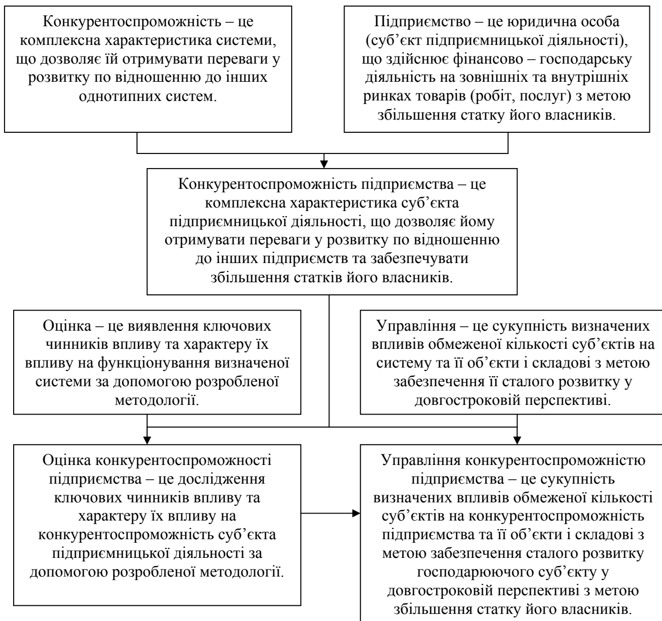
Рис. 1. Графічна інтерпретація визначення сутності та взаємозв'язку між термінами «конкурентоспроможність», «конкурентоспроможність підприємства», «оцінка конкурентоспроможності підприємства» та «управлінням конкурентоспроможністю підприємства»

Конкурентоспроможність є ключовою характеристикою фінансово-господарської діяльності підприємств та головним чинником забезпечення їх довгострокової прибуткової діяльності у сучасних умовах розвитку світової, національних та регіональних економічних систем, що потребує постійного управління, яке не можливо здійснювати без проведення оцінки. Наведене вимагає визначення сутності та взаємозв'язку між «конкурентоспроможністю», «конкурентоспроможністю підприємства», «оцінкою конкурентоспроможності підприємства» та «управлінням конкурентоспроможністю підприємства» (рис. 1).