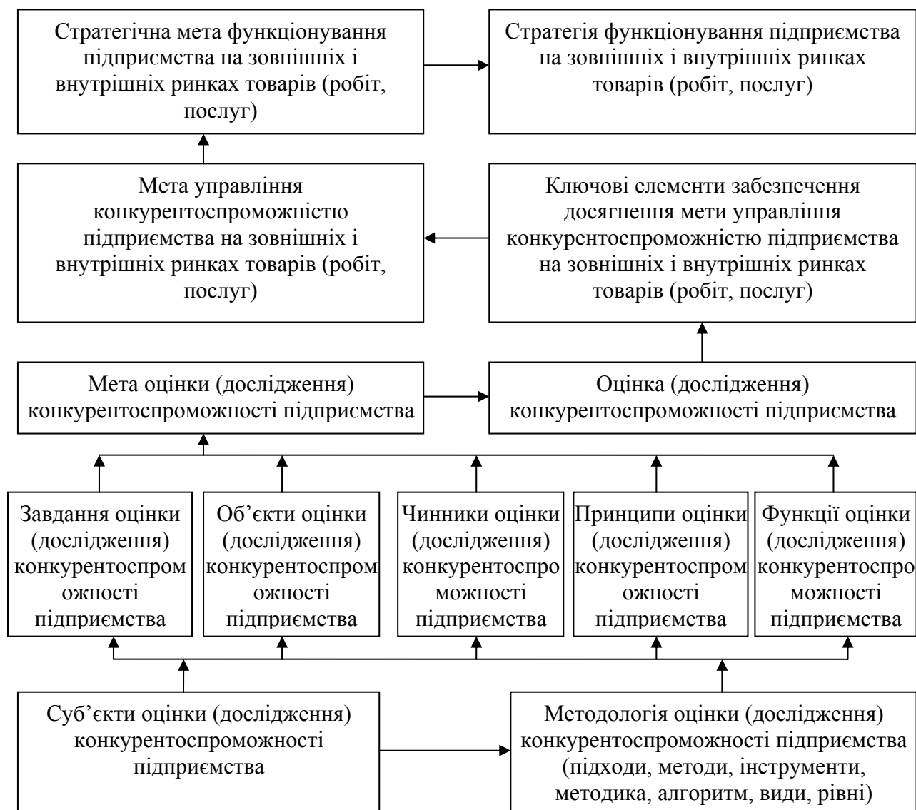
Рис. 2. Теоретико – методологічні основи оцінки (дослідження) конкурентоспроможності підприємства