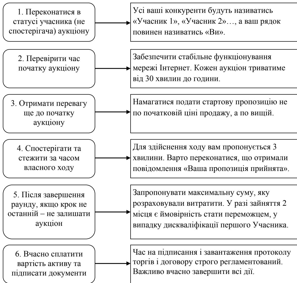
Рис. 3. Рекомендації щодо ефективнішої участі в аукціонних торгах в системі публічних закупівель Prozorro