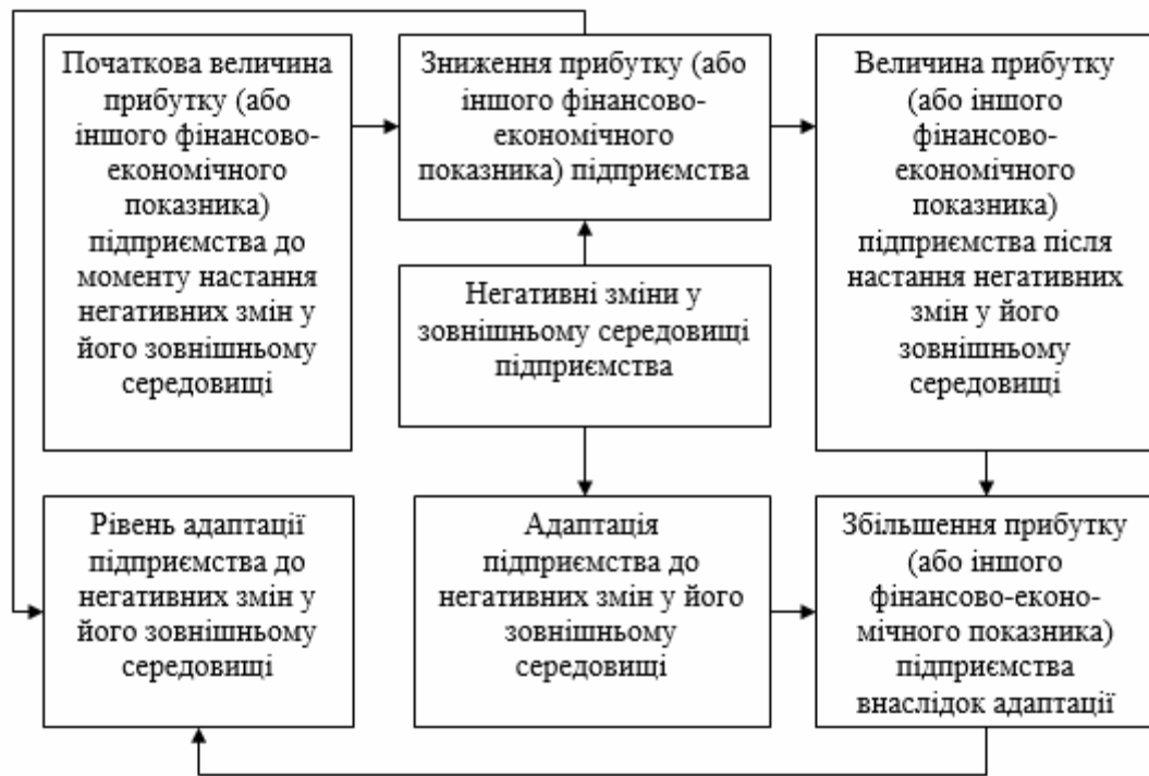
Рис. 2. Модель оцінювання результатів адаптації підприємства до негативних змін у його зовнішньому середовищі Складено автором

Базуючись на представлений на рисунку 2 моделі, можна запропонувати такий показник рівня адаптації підприємства до негативних змін у його зовнішньому середовищі: