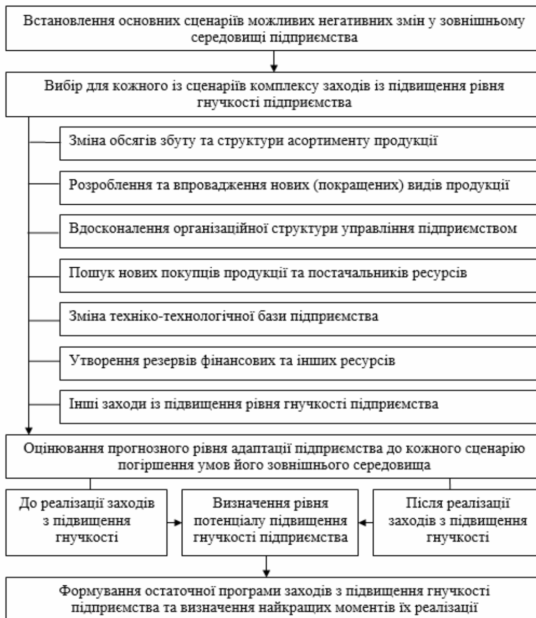
Рис. 3. Загальна модель оцінювання потенціалу підвищення гнучкості підприємства стосовно адаптації до негативних змін у його зовнішньому середовищі Складено автором

позитивних змін у зовнішньому середовищі, проте, у цьому випадку базою для відповідних розрахунків виступатиме формула (2).