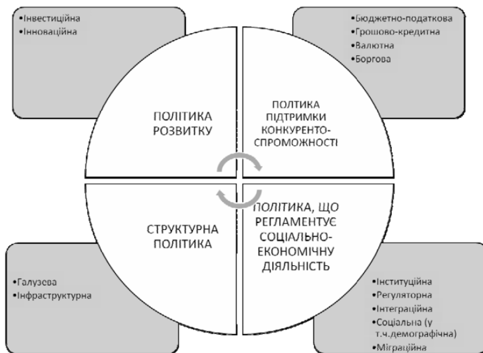
Рис. 1. Політика протидії сепаратизму та ірідентизму з позицій економічної безпеки

На нашу думку, економічні механізми політики протидії сепаратизму та ірідентизму в Україні з позицій економічної безпеки слід розглядати в контексті: а) інструментів політики, що регламентує соціально-економічну діяльність; б) структурної політики; в) політики розвитку; г) політики підтримки конкурентоспроможності.