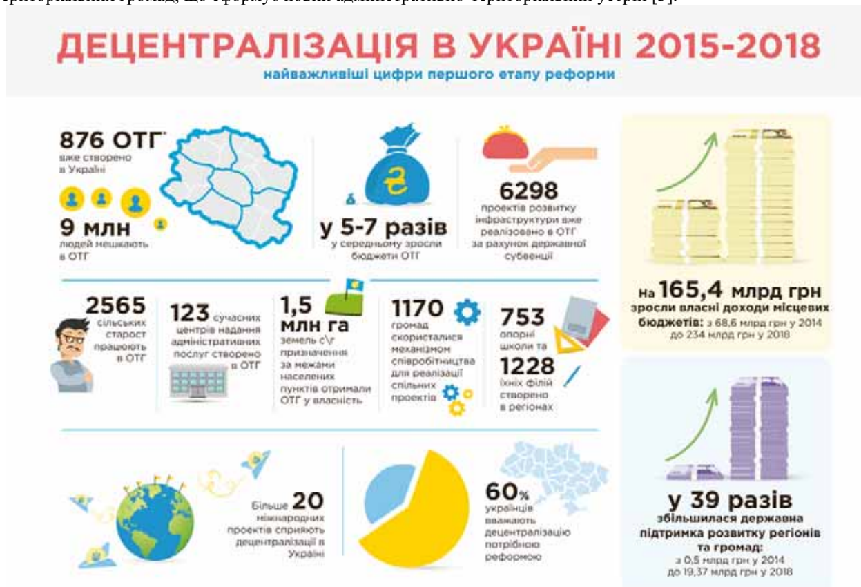
Рис. 1. Результати першого етапу децентралізації в Україні [2]

На другому етапі реформи Уряд визначив основні завдання для продовження децентралізації (див. рис. 2), одним з яких залишається створення належної ресурсної бази для здійснення повноважень місцевого самоврядування, насамперед ОТГ[2]. В червні 2020 року в Україні прийнято пакет нормативно-правових актів задля закріплення в правовому полі територіальної основи, яка дає змогу, нарешті, забезпечити повсюдність юрисдикції органів місцевого самоврядування в межах території кожної з утворених спроможних територіальних громад, що сформує новий адміністративно-територіальний устрій [3].