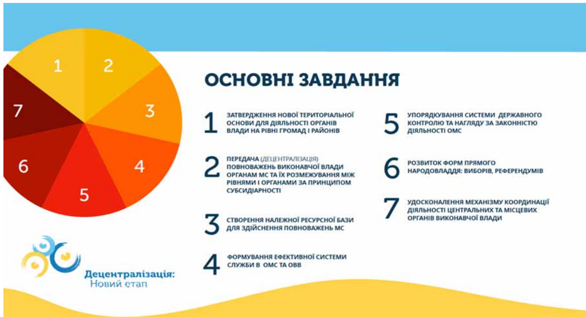
Рис. 2. Завдання Уряду на новому етапі децентралізації [2]

Аналіз свідчить, що бюджетну спроможність ОТГ можна: