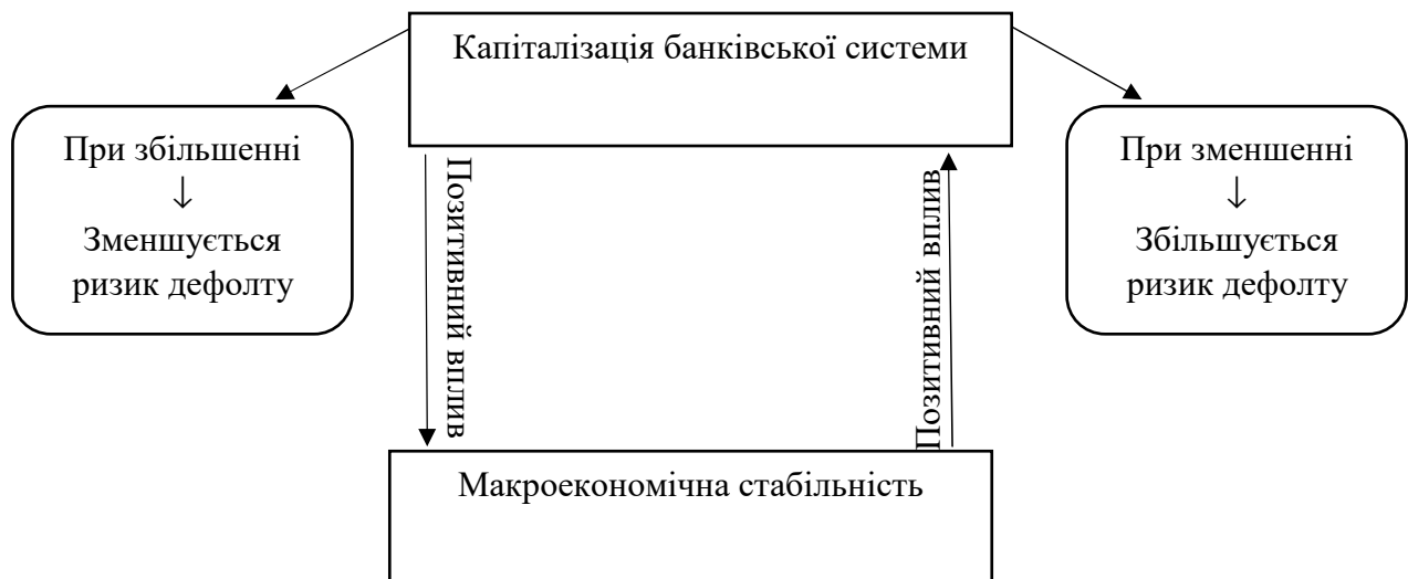
Рисунок 4. Взаємозв'язок капіталізації банківської системи та макроекономічної стабільності (створено автором на основі [3-9])

Ці показники позитивно впливають один на одного. При цьому стабільність вітчизняного ринку можна досягти за рахунок адекватної капіталізації банківських установ.